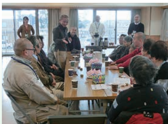
支援活動での様子

常に被災者の方々を主として、相手と「共に生き、共に学び、共に歩む」存在であるという意識で活動するよう努力しています。 私たちは今後の支援活動においても、継続することを目的とせず、いま此処で被災地・被災者とともに歩む」という菩薩行の実践に取り組みたいと思っています。私たちは現地の方々から、謙虚に教えていただき、被災者の自助を促せる支援をこれからも考えていきたいです。