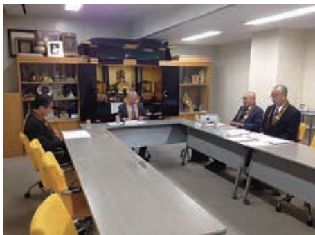
評議員選定委員会の様子