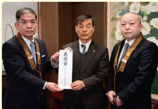
常総市へ義援金を手交

今回の豪雨により、尊い生命を奪われた皆様とご遺族に、衷心より哀悼の意を表しますとともに、被害発生から半年以上経過した今日においても、大変困難な状況で不自由な生活を強いられている皆様へ、心からお見舞いを申し上げます。