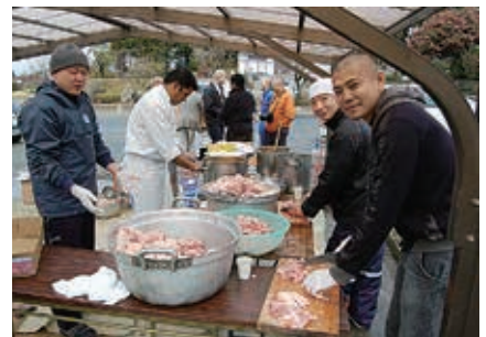
僧侶による被災地支援活動

つきましては、加盟団体・全国のご寺院・檀信徒・門徒、そして宗派・宗教を超えて、みなさまからの温かい浄財をお寄せいただければ、幸いです。