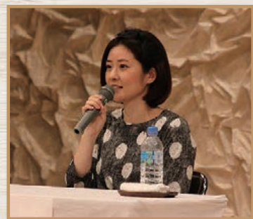
巡礼サミットで講演する 四元奈生美氏（プロ卓球選手）