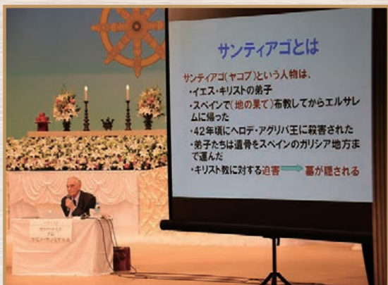
巡礼サミットで講演するホビノ・サンミゲル氏 （聖カタリナ大学学長）