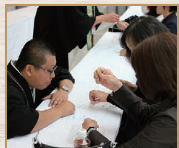
数珠作り体験の様様。二日目には順 番待ちで長蛇の列が