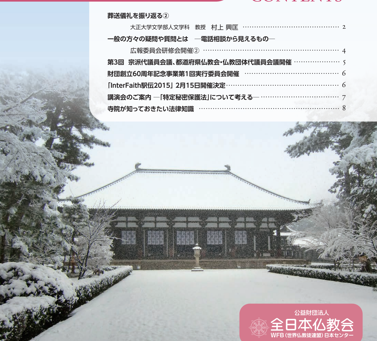
唐招提寺の雪景色