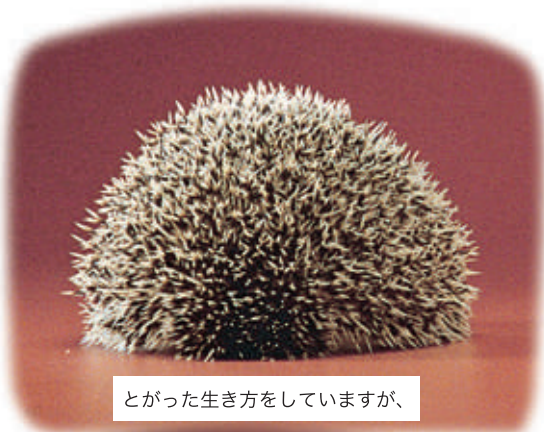
とがった生き方をしていますが、