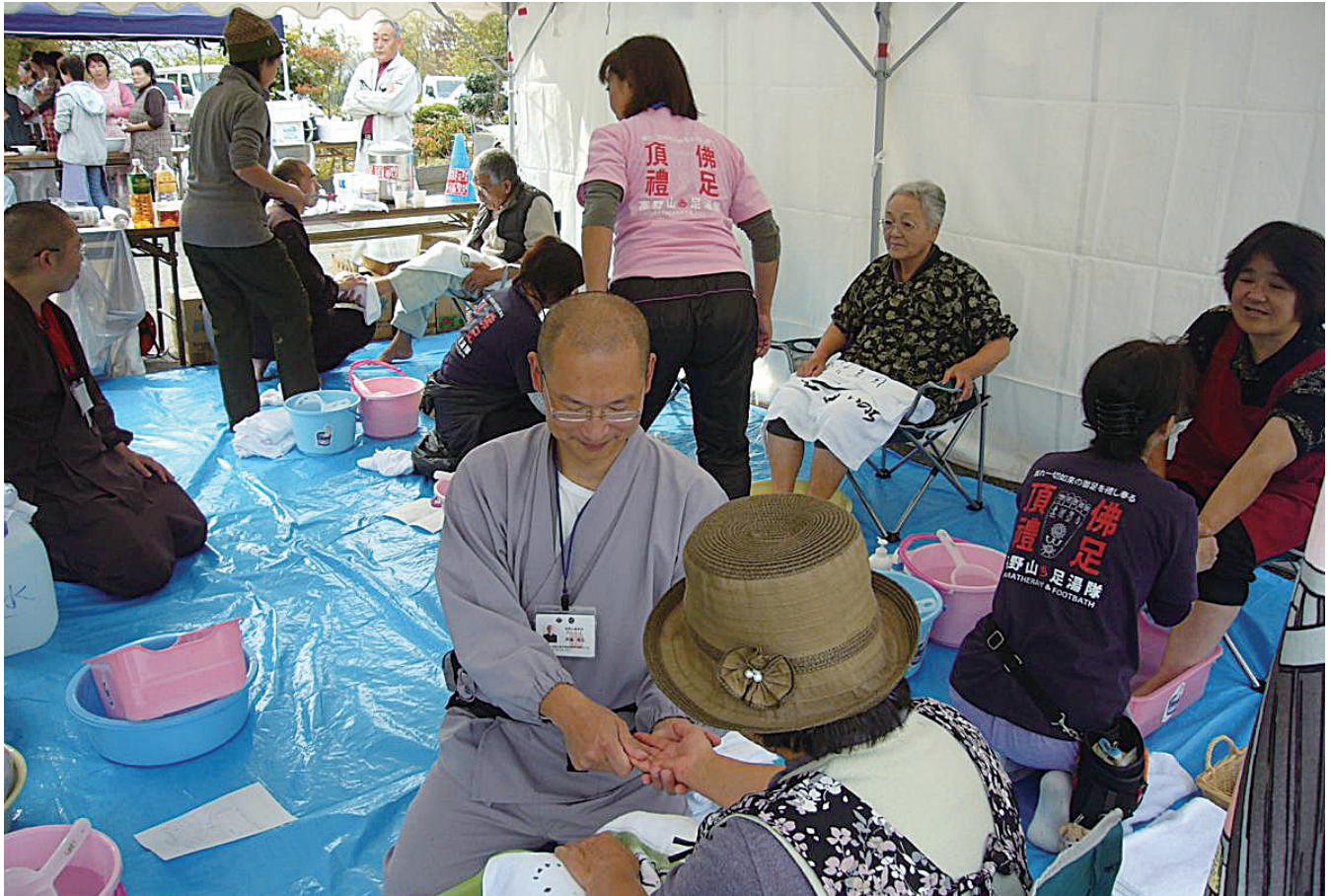
「南三陸町歌津、吉野沢仮設住宅地での足湯支援の風景」(高野山真言宗 高野山足湯隊)