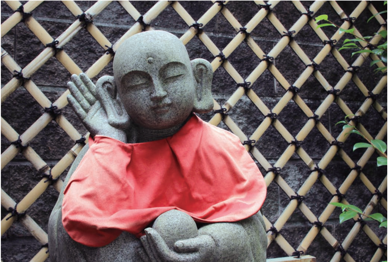
名古屋 桂芳院の愚痴聞き地藏さま