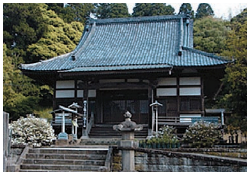
大本山鷲山寺 (千葉県)

法華宗本門流ホームページ http://www.hokkeshu.or.jp/ 興隆学林専門学校ホームページ http://www.gakurin.ac.jp/