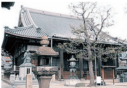
大本山本興寺 (兵庫県)