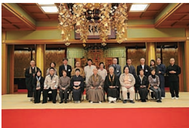
参加者一同と河野会長による集合写真撮影

河野会長の乾杯の挨拶の後参加者へ会長御真筆色紙と扇子のプレゼントが行われ、参加者の皆様には大変満足していただきました。