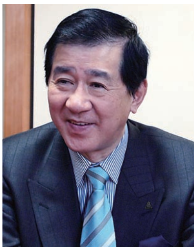
河野太通会長 プロフィール 元花園大学学長、社団法人アジア南太平洋友好協会RACK会長、臨濟宗妙心寺派三十三代管長、全日本仏教会会長