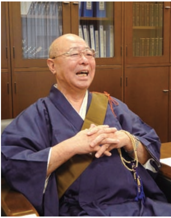
二瓶海照法華宗本門流宗務総長

題の一つと考えており、興隆学林という専門学校を持っております。卒業すると僧侶としての資格を得られますが、三年に一度、教学講習会を受講し試験を行い、それをクリアしなければ僧階が上がらないという制度となっております。「ハードよりソフト」を基本の考え方とし、教師の育成、信徒の信仰増進、寺庭婦人や檀信徒等の研修を各教区で進める事を積極的