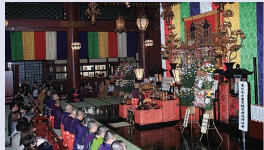
○聖観音宗 金龍山浅草寺 浅草寺一山総出仕による法要が本堂で厳修。鳴鐘が行われ、多くの参拝者が参列した。