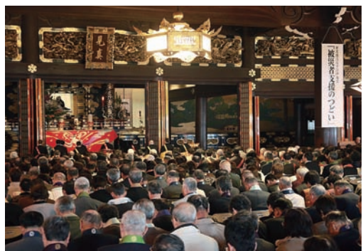
満堂の御影堂（写真は被災者支援のつどい）

第三期法要は五月十九日から二十八日まで厳修される。なお、法要は真宗大谷派ホームページにてライブ配信している。