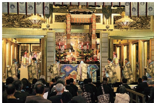
大谷光真門主導師のもと法要が修行された

浄土真宗本願寺派（橋正信総長、京都市下京区）の親鸞聖人750回大遠忌法要が「世のなか安穩なれ」のスローガンのもと、四月九日から本願寺・御影堂で始まった。宗祖親鸞聖人のご遺徳を偲び、お念仏のみ教えを受けとめ伝え広める機縁とするともに、東日本大震災で被災された方の悲しみに寄り添い、思いを分かち合うことを願いとし、来年一月十六日まで青少年・幼児を対象とした法要行事を含め、六十五日間百十五座にわたり修行され、四十万人が参拝する予定。四月は十六日までの八日間、被災地を含め全国から団体参拝を中心に一日六千人を超える門信徒が参拝。「書院・飛雲閣」拝観や本山