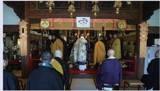
○高野山真言宗 神奈川県横浜市 大聖院 高野山真言宗神奈川自治布教団主催、鳴鐘が行われた。役員と支所下寺院住職30名が参加した。