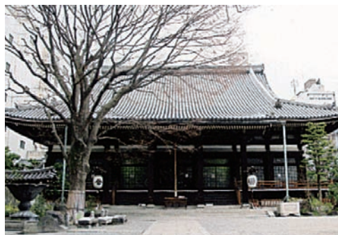
大本山本能寺 (京都府)