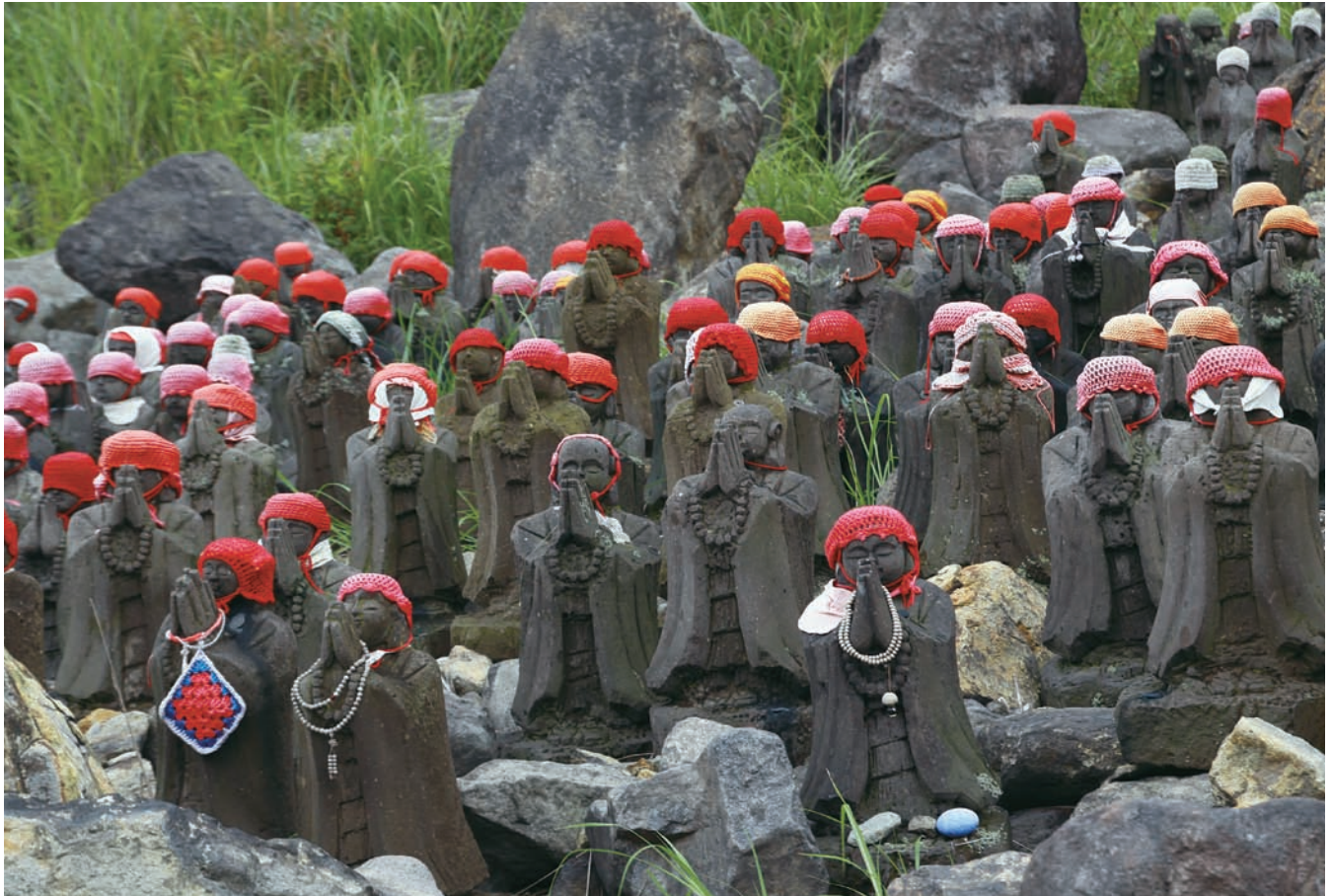
那須高原 殺生岩の千体地藏さま