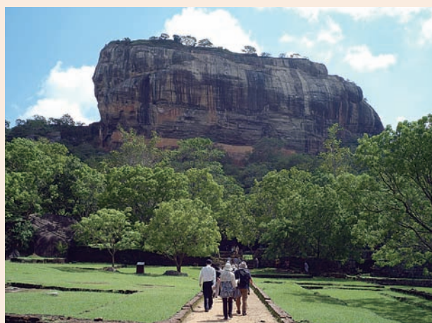
世界遺産シギリヤロック

※P6～P7で報告した内容の一部を掲載しております。※HPにて詳細を掲載しております。是非ご覧下さい。