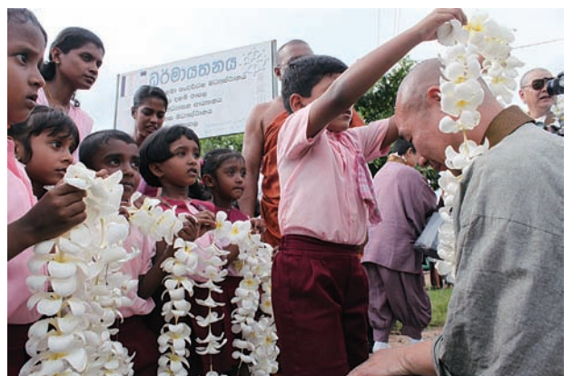
身延山スリランカ別院にて園児より歓迎を受ける参加者

WFB創立六十周年記念祝典の場で、日本代表として登壇した河野太通全日本仏教会会長は、スリランカ大統領をはじめ世界各国から集まった仏教者代表、仏教徒の前で、改めてジャヤワルデネ元大統領の演説に感謝し、各国に与えた事実の懺悔と反省の意を表し、