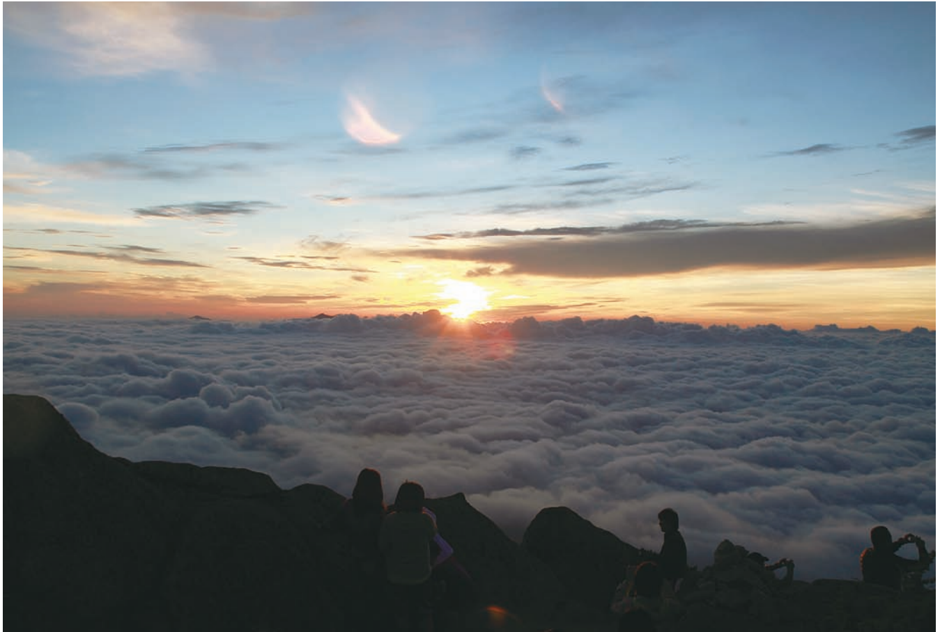
南アルプス 薬師岳からのご来光