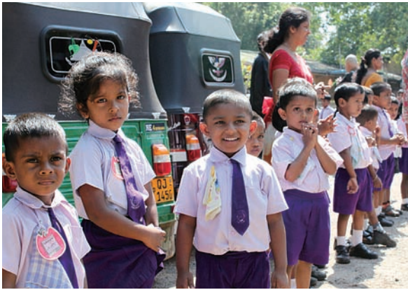
大菩提会にて園児による歓迎の様子

私自身、初めてのスリランカ訪問でしたが、ツアーを通じた印象は一言、仏教が生活の中にごく当たり前のようになりと根付いている国だということでした。ホテルのロビーや学校、病院の庭、街道の交差点、バスの運転席、あら