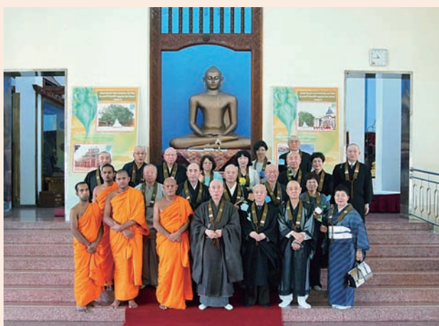
大菩提会本堂にて集合写真