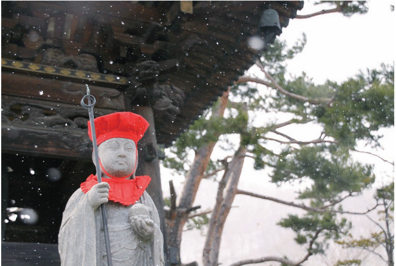
北海道札幌市 浄国寺のお地藏さま