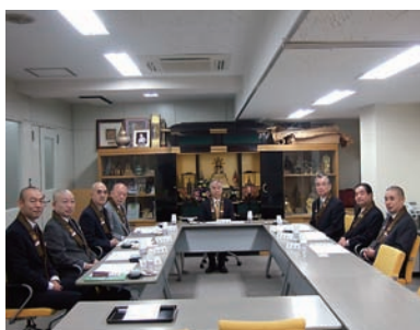
最初の評議員選定委員会

慎重審議の結果、候補者十名全員を、公益財団法人移行後の最初の評議員に選任することを出席委員全員一致で可決した。