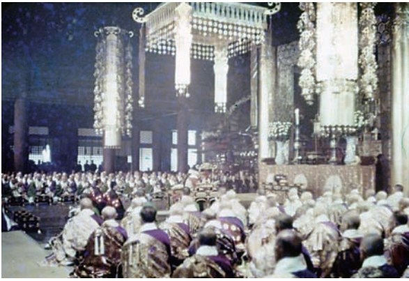
750年大遠忌法要の様子（総本山知恩院）