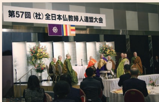
物故者追悼法要が営まれた