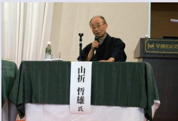
シンポジウムにて講演する山折哲雄氏