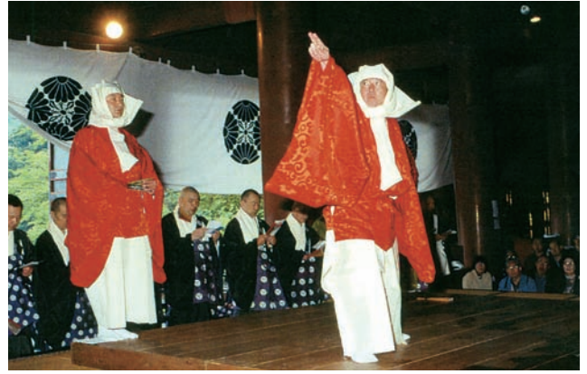
日光山輪王寺に伝承される「延年の舞」