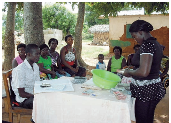
農村のグループミーティングで返済金の回収（ガーナ）

マイクロファイナンスへの需要は高い半面、労働集約的な産業であり、必要な手間ひまを考えるとそう簡単に顧客数を増やすことはできません。あるマイクロファイナンス事業者は、「最初は時間も手間もかかり難しい。しかし、一端事業が軌道に乗れば、時間をかけてサービスを使える顧客数を増やしていくことは可能だ」と思う」と話していました。二〇〇六年に