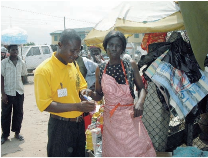
返済金の集金（ガーナ）

クロファイナンスは人々がよりよい生活を営む一助となっています。その半面お金と時間と人手をかけて顧客のモニタリングを適切に行わないと、マイクロファイナンスは事業として成り立ちません。特に人口密度が低く、広大な土地のあちこちに集落が点在するアフリカ諸国では、職員が定期的に顧客を訪問することは大変ハードです。あるマイクロファイナンス事業者はできるだけコストをかけずに顧客グループを回るため、職員はバ