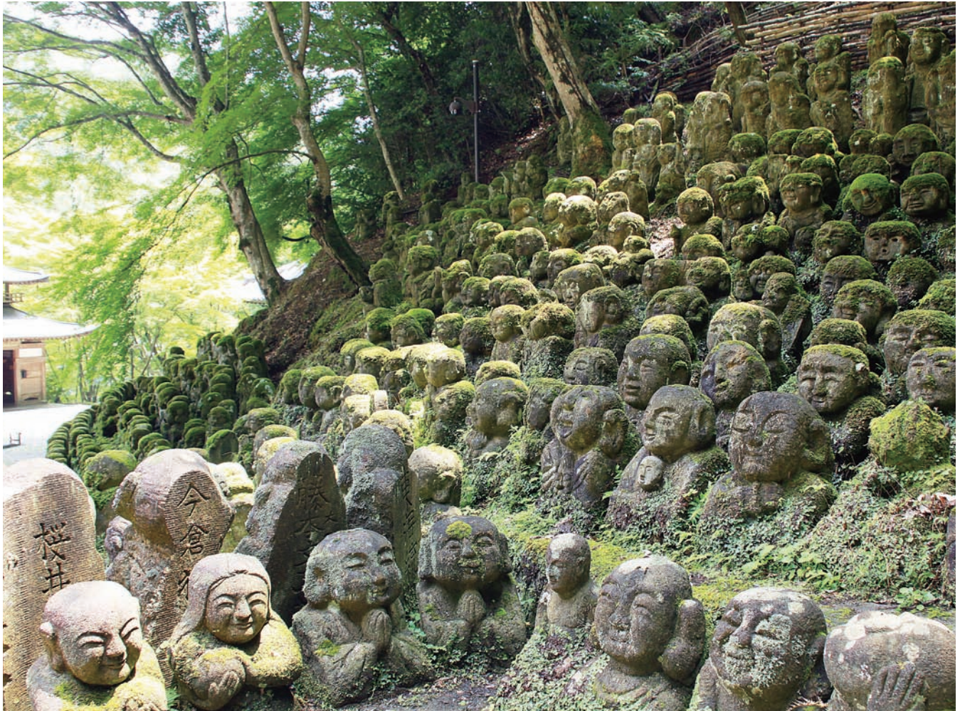
京都 愛宕念仏寺の羅漢さま