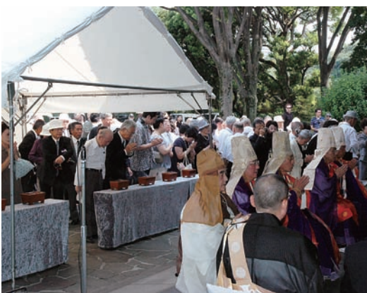
焼香を行う参列の檀信徒及び遺族会の方々

午前十時法要が終了後、小憩。青年僧侶らが「世界立正平和祈願」を旗印に池上・本門寺と谷中の寺町方面等に分かれて、玄題旗を先頭に団扇太鼓を持ち、唱題行脚を行った。