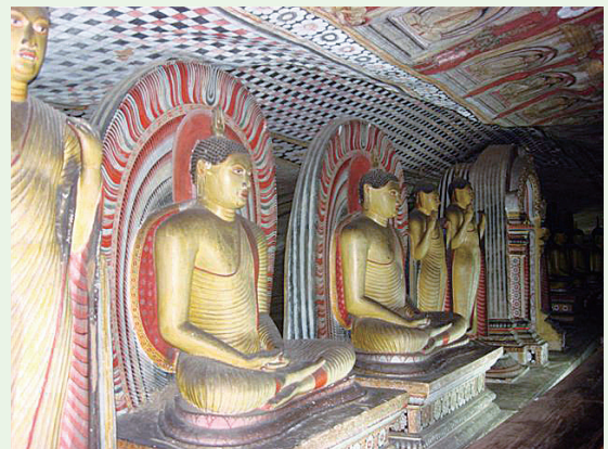
ダンブラ石窟寺院