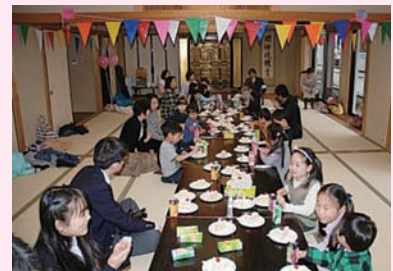
4月4日 真宗会館にて。

写真は集まっておやつを食べている様子。当日はバレエやピアノの発表会、綿菓子の配布もあり、100人を超す参加者が訪れた。