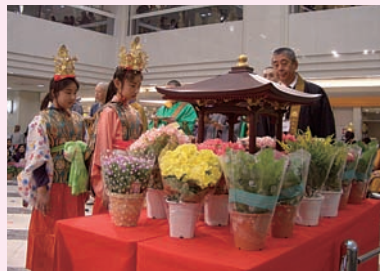
4月2日 池袋サンシャインシティアルパB1噴水広場にて。

写真はお稚児さんによる灌仏の様子。当日は法要や楽器の演奏を行い、買い物客に鉢植えや花の種を配付し、地球温暖化防止をアピールした。