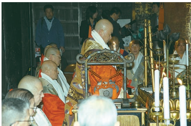
晋山・上任奉告法要の様相

二十八期会長が出席し「弘法大師の若い時、吉野を本拠地として修行に努められたとお聞きして吉野山は身近に感じていた」と語り「仏教の厳しい修行が要望されてくるし、それが僧侶としての役割であると自覚し、さらにそれが展開していく大きな要素になるだろう」と述べられた。