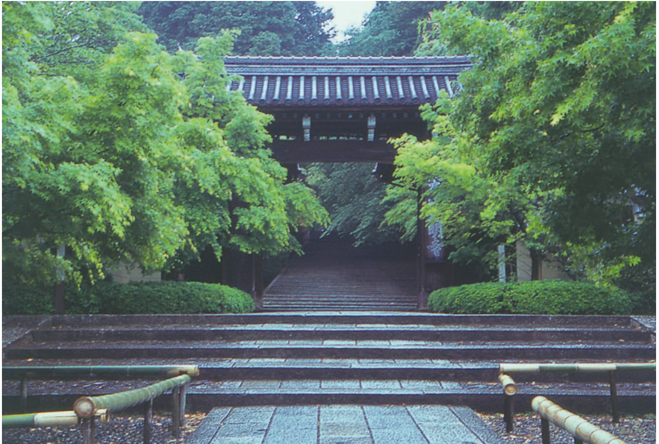
長岡京市 新緑の光明寺