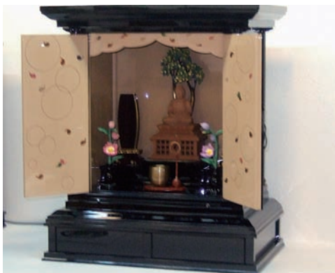
全日本仏教会会長賞受賞作品 『散蓮蒔絵入御厨子』