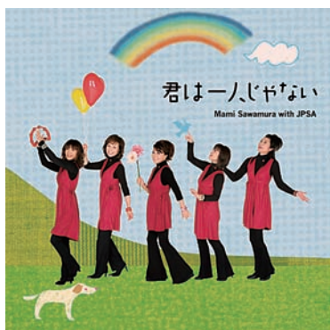
CD「君は一人じゃない」に発表の「ハッピーバースデーお釈迦さま」

これらの活動が日本人のこころに仏教的基盤を確立し、仏教伝道の一助になればと考えております。