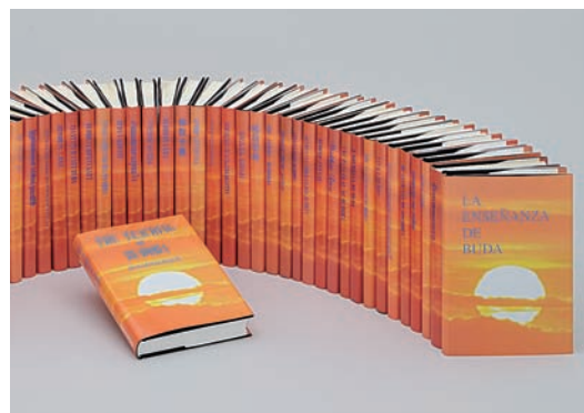
各国語の『仏教聖典』がホテル・病院等に常備されている

さらに点字による『点字聖典』や、日本手話に翻訳した『手話聖典』、仏教聖典を朗読した『仏教聖典C