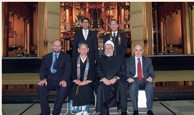
本堂前で記念撮影を行うアリー・ Gum ア・エジプト大ムフティー（前列右から2人目）と豊原大成理事長（前列左から2人目）

外務省より、日本政府がアリー・ Gum ア・エジプト大ムフティー及びイブラヒーム・ナグム同補佐官を日本に招聘するにあたり、日本の仏教者と面談したいとの依頼があり、3月9日日本願寺築地別院に於いて豊原大成本会理事長と面談がなされた。出席者は Gum ア大ムフティー、ナグム補佐官、アブデルナーセル在京エジプト大使、カドリ在京エジプト大使館書記官、本橋和夫氏（エスコート）、山本大介（外務省）、豊原理事長、本会国際部2名、以上8名。