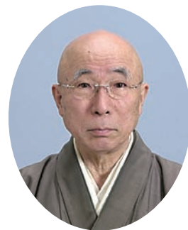
臨濟宗妙心寺派第三十三代管長