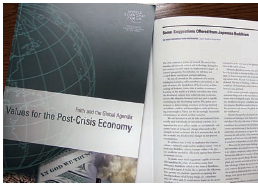
提言は会議議題集に英文掲載され、広く配布された

日本仏教の考えからすれば、自と他、個と全体、物と心というように、一般に対立的に考えられている存在は、もとより一体である。ものごとを分析的により分け、細分化することによって、ものの本質は見えてこない。むしろ対立的な思考を捨てて、全体的に把握することによって、ものの真実の姿が現われてくると見る。