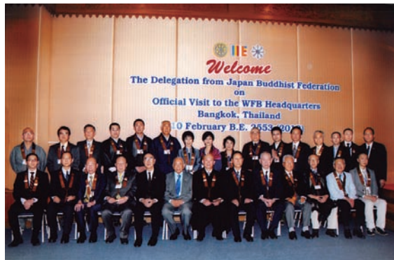
WFB（世界仏教徒連盟）本部表敬訪問 2010年2月10日

法要後、本会救援基金より五百万円、浄土宗平和協会よりインドネシア・スマトラ沖大地震復興支援に本会救援基金を通して百万円、