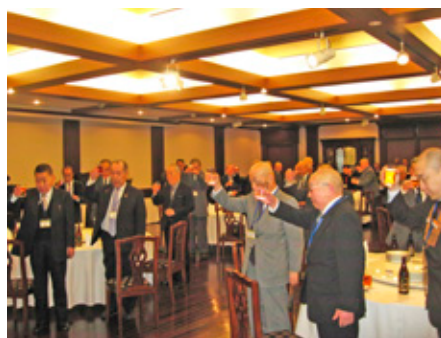
会場に詰めかけた参加者