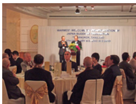
歓迎晩餐会にて挨拶するパロップ・タイアリーWFB事務総長(壇上右)