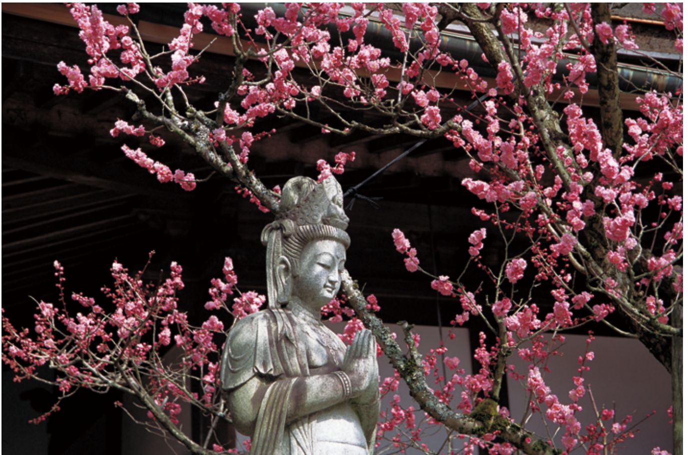
高野山 大円院の横笛の紅梅