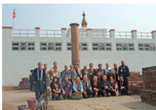
ルンビニー園マヤ堂・アショカピラー前で記念撮影を行う参加者一同