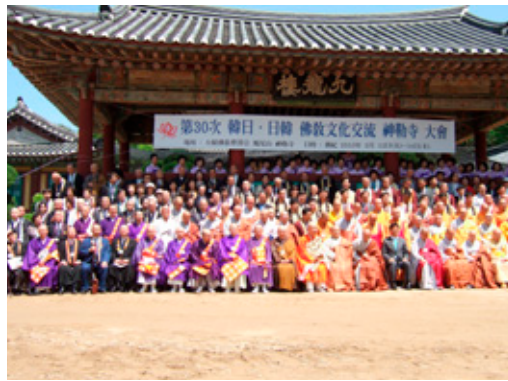
三百名を超える参加者が一堂に会した

日韓仏教交流協議会（会長宮林照彦師）と韓日佛教文化交流協議会（会長智冠師）は、日本と韓国の両国仏教徒の交流・親善を図るために、毎年日本と韓国で交互に大会を開催している。昭和四十七年に韓国の扶余に、日本仏教徒の総意を集めて「仏教伝来謝恩碑」を建立した。これにより昭和五十二年に全日本仏教会のもとに発足し、第一回大会をソウルで開催した。その後は三度の中断があったが、歴代有志諸大徳のご尽力により現在に至っている。今回は交流大会三十周年記念人類和合共生祈