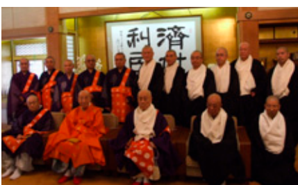
高野山真言宗内局及び天台宗内局の記念撮影