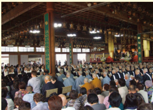
法要には多数の人々が詰めかけた