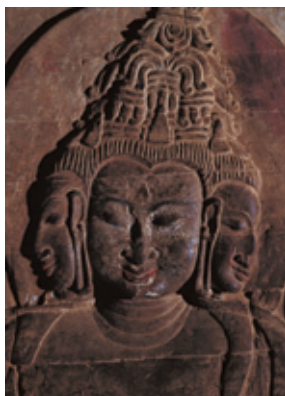
プラフマー(梵天)像 11世紀頃(パガン)