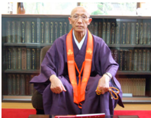
関根真教新義真言宗管長

総本山根来寺（和歌山県岩出市）は、「根本大塔」が国宝に指定されており、境内に残る中世の佇まいや四季折々の桜・青葉・紅葉が多く、参拝者の目を楽しませ、心を癒しています。