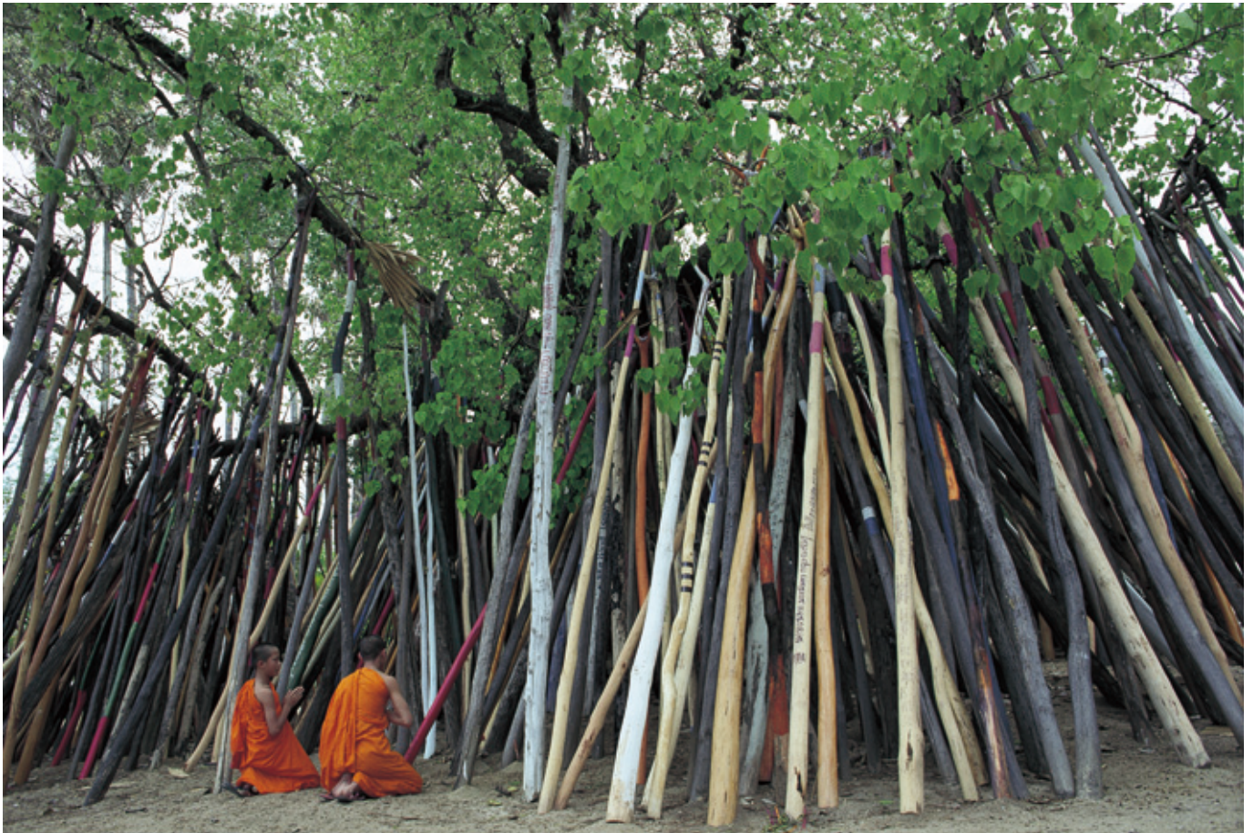
菩提樹にたくさんの添え木が奉納され、その前で祈念する沙弥（ランパーン、北タイ）