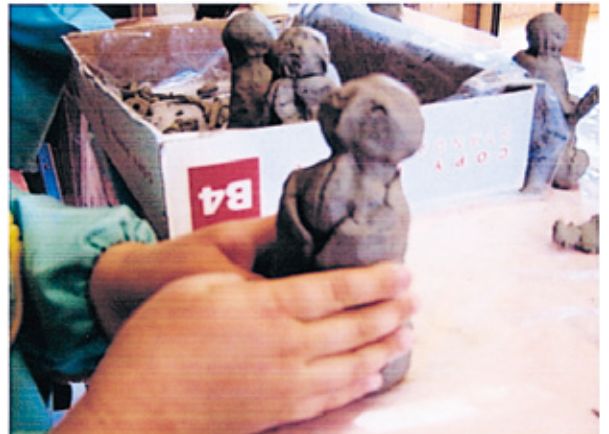
お仏壇に納める仏様を粘土で作る