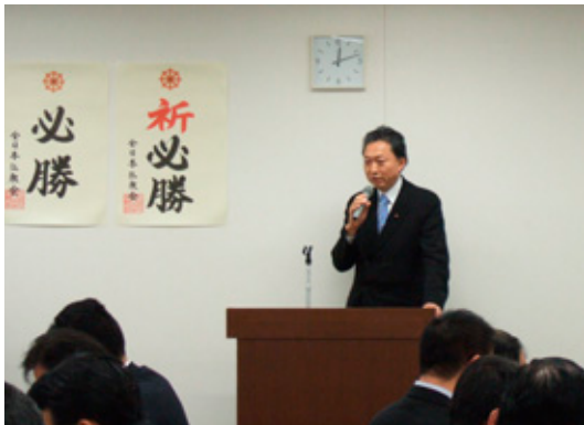
挨拶を行う鳩山由紀夫仏教議員連盟代表

本会から「首相及び閣僚の靖国神社公式参拝中止要請」、「適切な宗教教育推進」に向けた取り組みや活動・組織について説明。仏教界へのさらなる理解を得るために仏教懇話会・賛助会員等への入会を促すとともに、国政選挙に向けた全仏推薦に関して説明を行った。