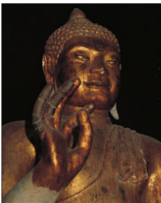
タワラーワデー期の 如来像(8世紀頃)