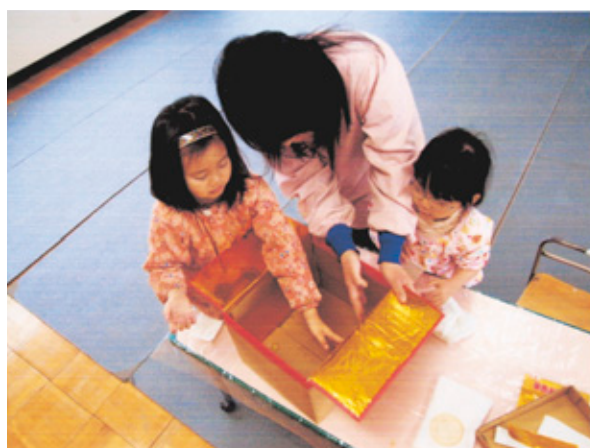
ダンボール箱でお仏壇を作りました

愛い我が子の為のお仏壇です。お腹の中から誕生、幼児期、小学生を対象としたものです。