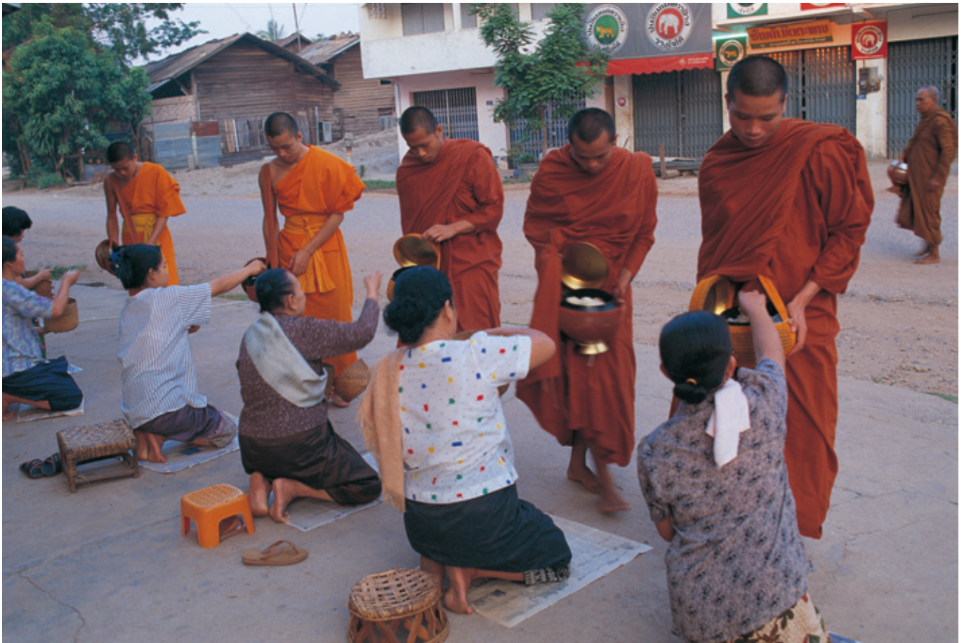
早朝、ルアン・パバーンの町で食事の布施を受ける僧侶たち(ラオス)