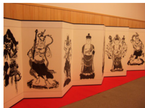
墨絵仏画の展覧会 「みほとけの宇宙展」の様

他の活動としては、埼玉県各流讃佛歌奉詠大会を毎年開催し、六十一回を数えます。大会の参加者は毎年千名を超え、布教及び交流に大いに活用して頂いております。埼玉県佛教徒大会も毎年開催しております。市町村の仏教会は