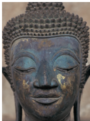
ワット・プラ・ケオ寺の青銅仏(16世紀)

ラオスを取材すると、革命後の70年代を思い出す。托鉢を禁じられた僧侶たちは田畑を耕し、自給生活を強いられていた。寺院内にはマルクスやレーニン、ラオス革命指導者の肖像が掲げられ、その前で僧侶たちは徹底した思想教育を強要されていた。仏教徒たちも日常生活の中で、お寺や僧侶との関わりをとっても大事にしてきたが、突然、革命の名のもとに精神的自由を奪われてしまう。失望した多くの僧侶や信徒たちは隣国のタイや他国に逃亡してゆく。80年代に入ると政権側も宗教の緩和をせざるを得なくなり、仏教はしだいに復興された。禁じられた托鉢も復活させ、現在は本来の伝統的仏教の姿をほぼ取り戻している。 (文章及び写真 田村 仁氏)