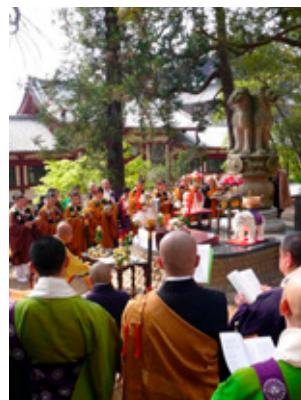
アシヨカピラー前での 声明発表

回数を重ねるうちに、より一層しっかりとした形での法要を行う、という気運が高まり、四月二十六日を「青年仏教徒の日」と定め、東大寺に於いて毎年法要を行わせて頂いております。本堂脇には、アシヨカピラ（アシヨカピラー）を安置しての法要をさせて頂きました。その仏前においてチベットの関する平和問題に関する声