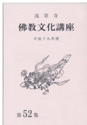
寄贈及び配布されている冊子

浅草寺は、「民衆の心の中に観音堂を立てよう」という考えのもと、各種布教活動を進めております。現在、各寺院や各宗派で仏教講座は盛んに開催されるようになりましたが、浅草寺では「浅草寺仏教文化講座」を昭和三十年より、一度も中断することなく六百回以上を開催し、現在も続いております。