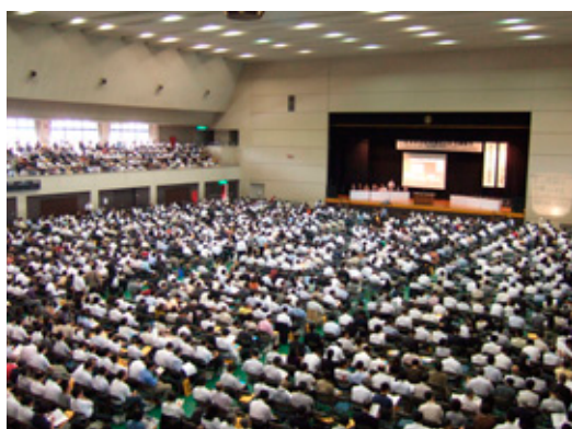
会場は多数の来場者で埋まった

次に、「被差別民の文化・芸能 ・産業技術」の分科会で、沖浦和 光氏（桃山学院大学）は、日本文 化の歴史には必ず悪所が関係し、 芸能・産業技術・交通・流通など が多くの部落民が携わってきたと の説明がなされた。