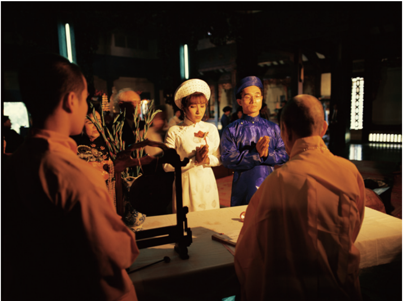
お寺の本堂で民族衣装を身につけ仏前結婚式が執り行われる(ベトナム)