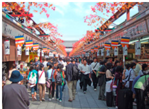
WFB大会に向け、仲見世通りの全ての商店に仏旗が吊されている

浅草寺の文献上の初見は『吾妻鏡』であり、源頼朝が養和元年（一一八一）に鎌倉の若宮八幡宮造営のため浅草から大工を招いたという記事が、また建久三年（一一九二）頼朝が施主となった後白河法皇の四十九日忌の法要に三人の僧が招かれた事により、浅草寺が名の知れた寺院となっていた事が判