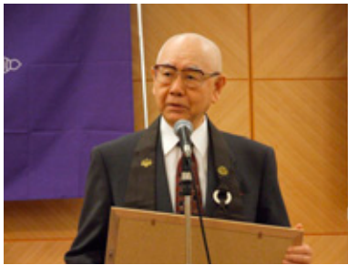
奈良康明大藏經データベース化支援募金会事務局長

http://21dzklu-tokyo.ac.jp/SAT/ 大藏經データベース化支援募金会 http://white.sakura.ne.jp/~sat-shienbokin/