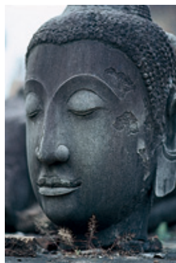
アユタヤ時代の仏頭(十七世紀)

祈りの世界 ④ タイ タイではどこに行っても黄衣をまとった僧侶たちの姿をよく見かけ、タイを象徴する風物詩となっている。お寺には一般の僧侶の他にサマネーンと呼ぶ少年の修行僧がいる。彼らの一日は早朝の托鉢に始まり午前中は仏法、午後は一般の中学や高校の教科を学びながら、お寺の戒律に従って修行生活が続いている。修行僧達はお寺の学校を卒業しお寺に残る人もいるが、多くは還俗して一般社会で働き、人々に尊敬の念を持って迎えられている。