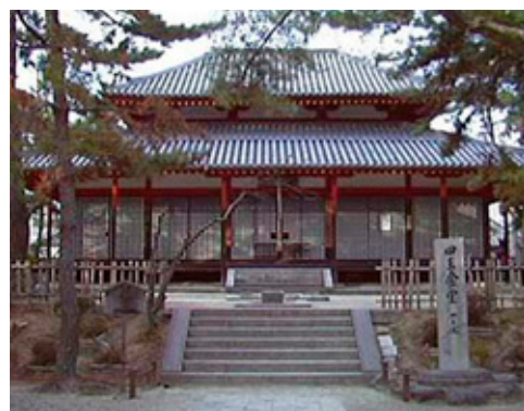
西大寺：四王堂 創建期の由緒を伝える堂

しかし、伝灯を護持していくことこそ大変に重要な我々に課せられた責務であり、宗祖の精神を堅持し愛宗護法の精神で向後に精進努力していくことが最も大事なこ