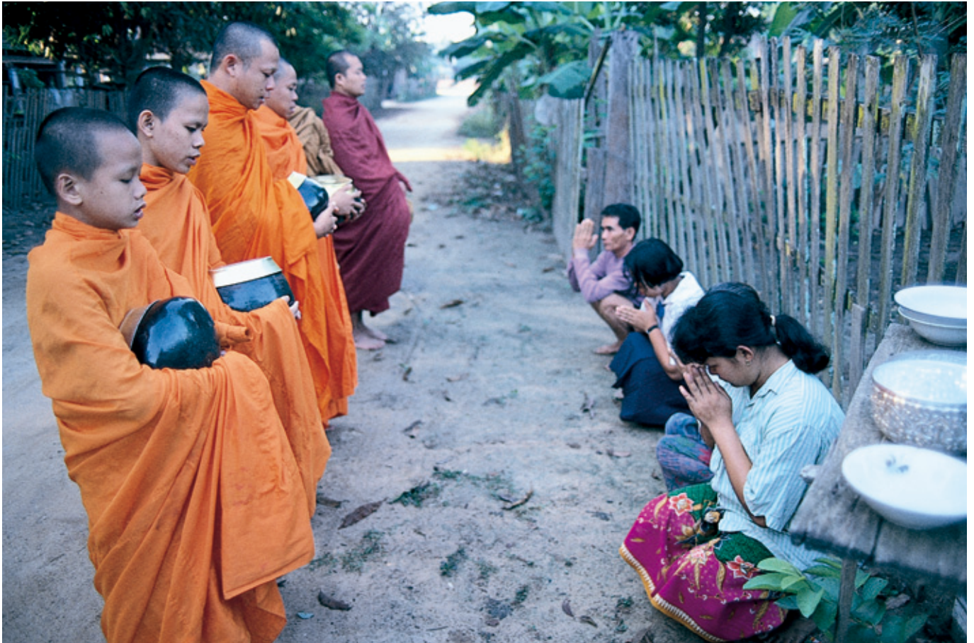
托鉢僧への喜捨(中部タイの山村)