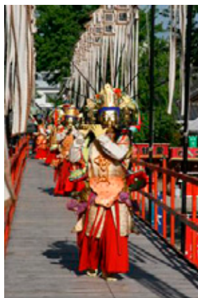
「万部おねり」の様子

また、最大の伝統行事として「万部おねり」を大念佛寺で五月初頭に行っております。二十五体の菩薩さまの絢爛豪華なおねりは圧巻で、非常に見応えがあります。より多くの方々に楽しんで頂けるよう広報活動に力を入れていきたいと思っております。