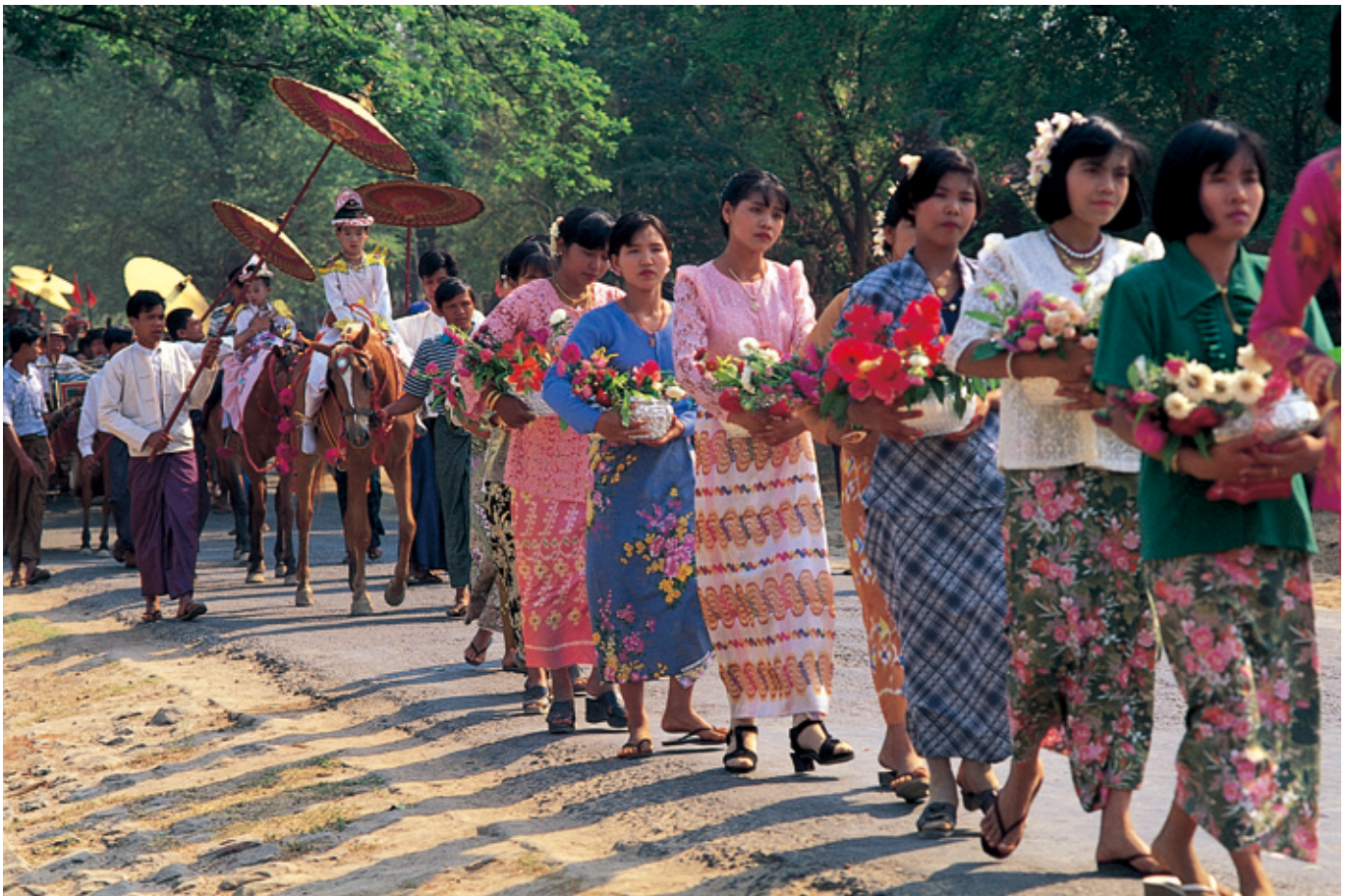
(得度式に向かう行列を先導する娘たち—ミャンマー)