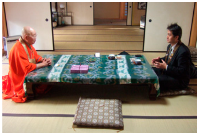
諸問題への鋭い指摘を多数頂きました

―本年財団創立五十周年を迎える本会の活動へのご意見・ご要望がございましたらお聞かせ下さい。