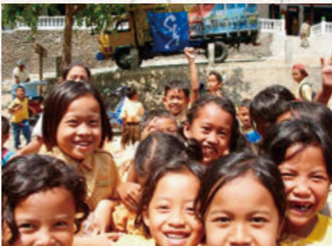
『子どもの遊び場』に集う子ども達