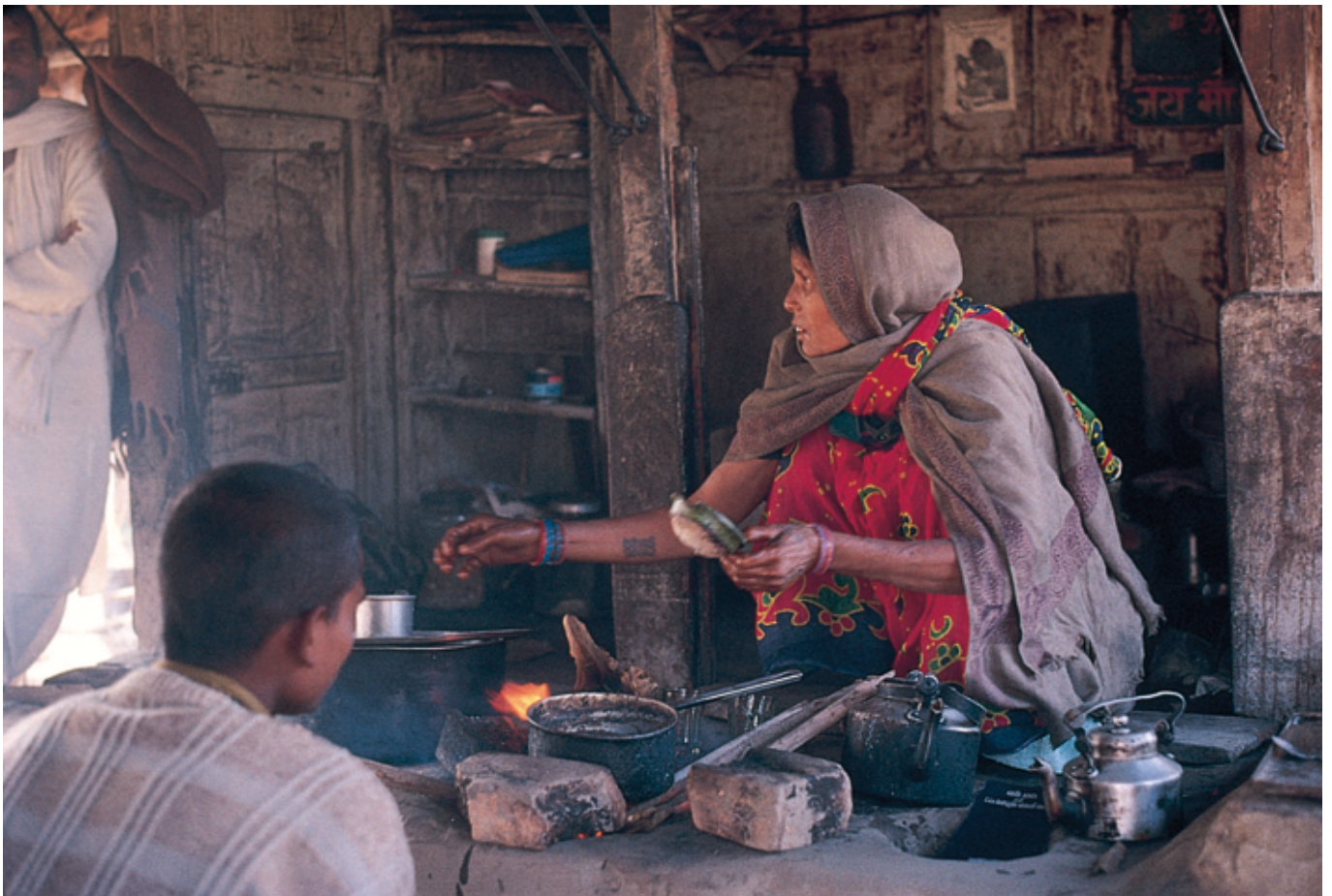
(インド仏跡参拝のあいまに「チャイ」)