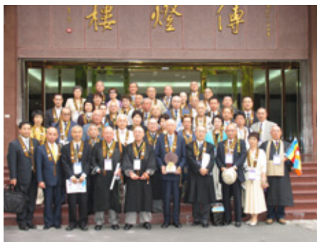
開会式会場(仏光山)の前にて、開会式後の集合記念写真

通例、WFBツアーは前半にWFB世界仏教徒会議の開会式への参加をしてから、各地を巡る形で行われてきた。しかし、今回は、実質、ツアーの最終日(二十日)に開会式へ参加した。