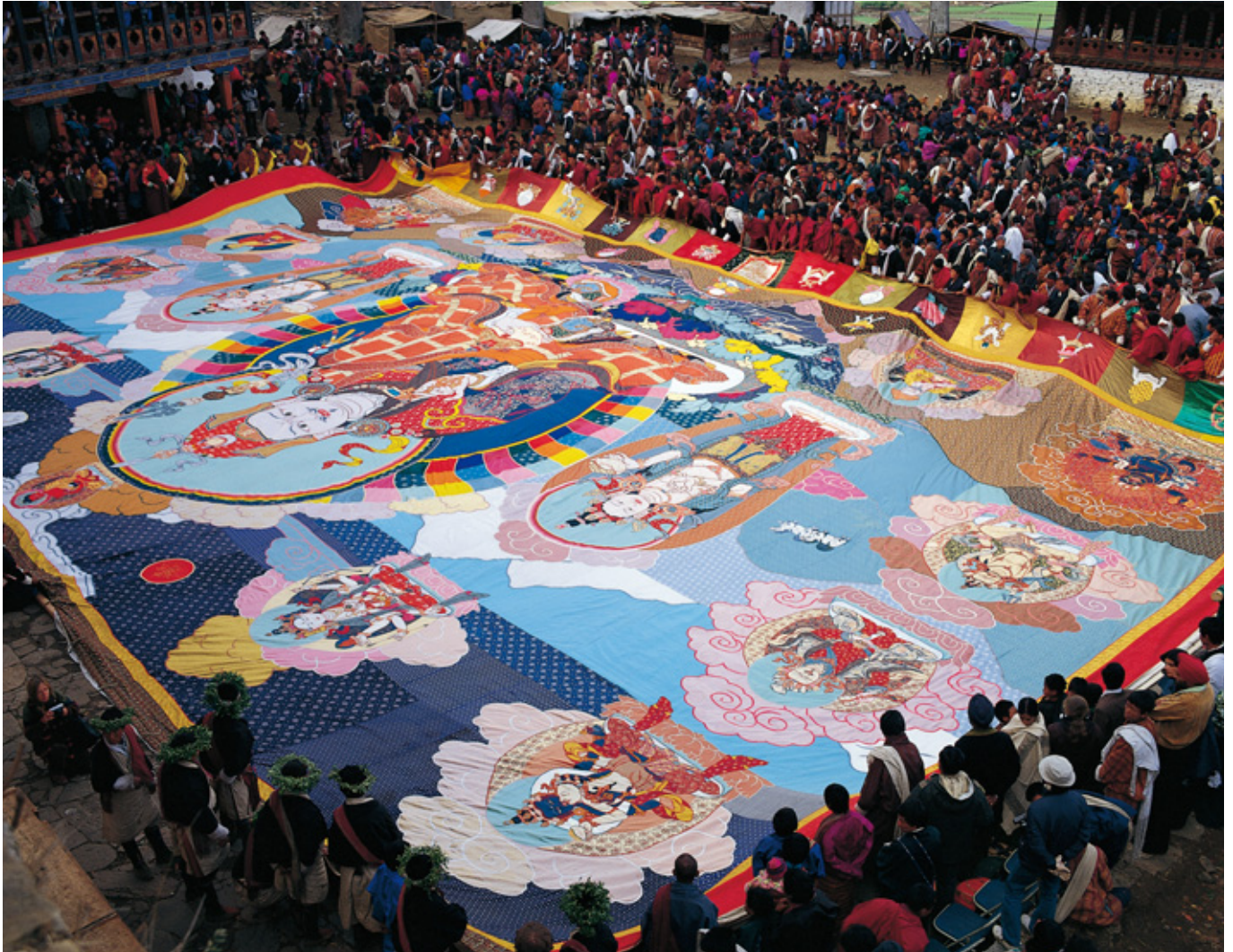
(ブータン：ツェチュ祭の大掛仏)