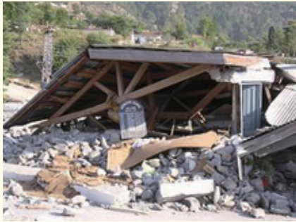
パキスタンのガリハビブラにある学校の様子

日本政府をはじめ各国の救助隊が現地で倒壊した家屋など捜索をはじめておりますが、発生から五日を迎え食糧も届かず、被災地の一部では略奪が起きていると報じられています。現地では多くの被災者の方々が救援を待っている状況にあります。