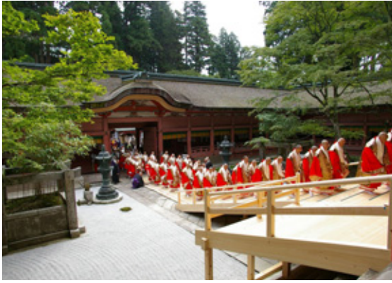
比叡山延暦寺根本中堂で行われた開闢法要

天台宗では開宗一二〇〇年にむけて、平成十五年より、「あなたの中の仏に会いに」をスローガンに、檀信徒総授戒・総登山運動や「アジア仏教者の対話集会」、京都国立博物館での特別展（十一月二十日まで）等を行い、慶讃