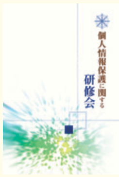
A5版 132頁 1部 800円(税込)