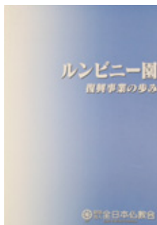
『ルンビニー園復興事業の歩み』 A 4版 無線綴じ 本文144頁 一冊 1,000円(税込)

マヤ堂の考古学的考察を中心とし、新たな発掘調査の結果を踏まえ、アシヨーカー石柱碑文の新解釈を論述し、遺構および出土遺物の図版等が豊富に収録されています。