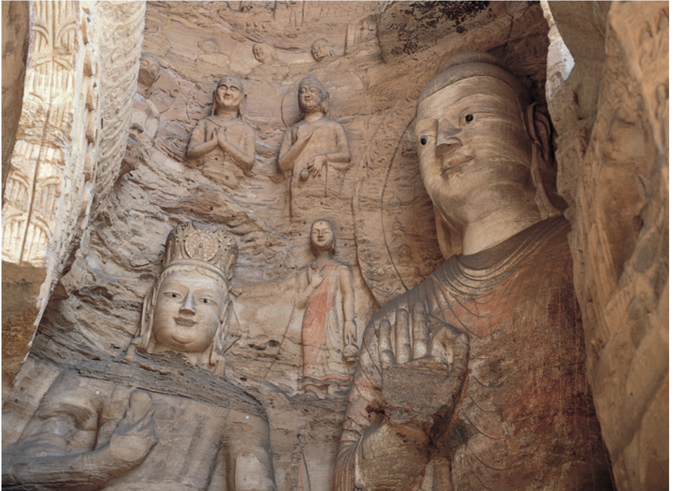
(世界遺産：中華人民共和国、雲崗石窟)