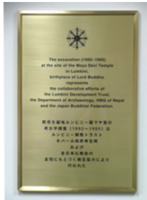
マヤ堂考古学調査記念プレート（780cm×520cm、真鍮製）

プレートを持参し、L D T及び、ブッディ・ラジ文化・観光・航空大臣（L D T委員長）にマヤ堂周辺への設置を要請した。