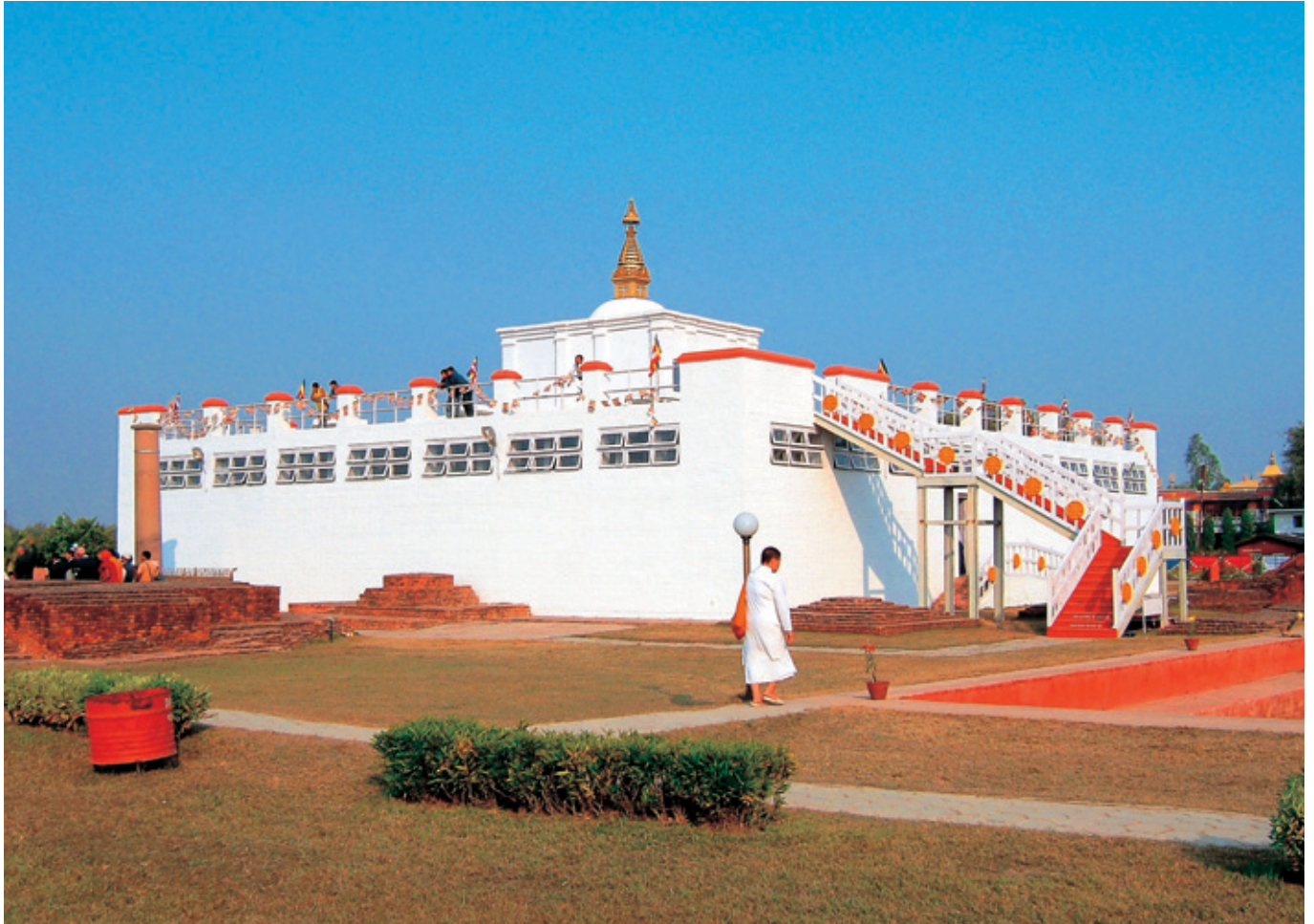
(世界遺産：ルンビニー園、新マヤ堂)