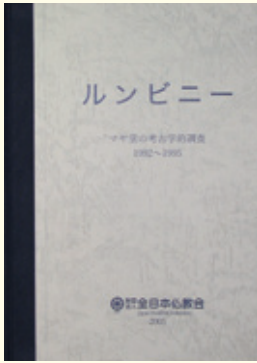
「ルンビニー マヤ堂考古学的調査 1992～1995」 A4版 上製箱入り 本文245頁 図版入 頒布価格10,000円(税込)