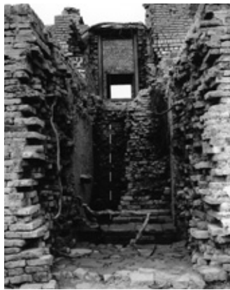
祠堂直下掘り下げ状態