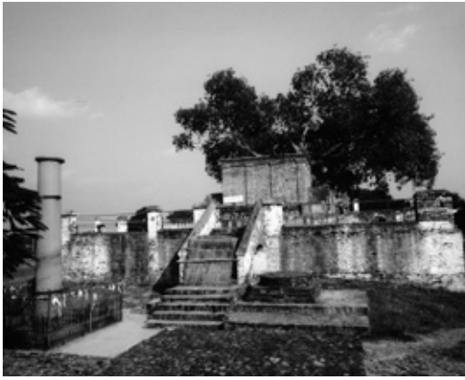
考古学発掘調査以前のマヤ堂とアショーカ石柱(左)

二）は即位後二〇年目に釈尊生誕の地であるルンビニーを訪れている。そして、石柱を立ててここが仏誕の土地であることを明示する碑文を残し、その南側に礼拝堂と思われる施設を建てた。それが今日のマヤ堂の前身である。