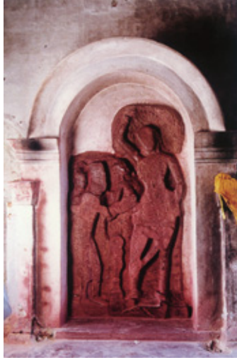
内陣内部マヤ夫人像安置状態