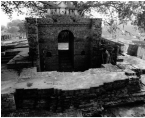
祠堂壁面上部除去状態