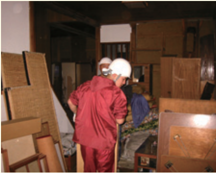
曹洞宗修行僧が被災寺院でボランティア活動

本会では、国内外における災害支援や人道的支援等に対し、緊急且つ迅速な支援対応をすべく、救援基金口座を開設しております。加盟団体、各寺院、檀信徒、門信徒のみならず