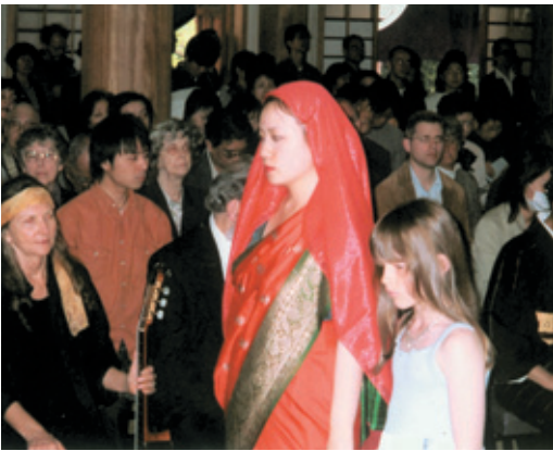
国際花まつり 外国からの参加者

また、法要の後、英語による法話やコンサートが行われ、野外では野点や琴が披露された。