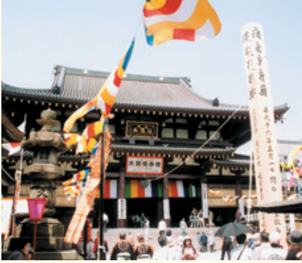
仏旗で彩られた平間寺境内

赤札の名号「南無阿弥陀佛」は、清らかな真心をもって阿弥陀如来に帰依すること、阿弥陀如来は無量の寿命を具えるということから、真言宗では息災延命の秘仏として尊ばれている。