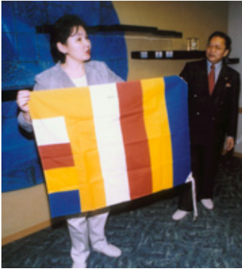
全日本仏教婦人連盟より仏旗を手渡されたオノギーンモンゴル首相夫人

十一月二十二日、東京・谷中の天王寺で、（社）全日本仏教婦人連盟がオノギーン氏（モンゴル首相夫人）を迎え交流会を行った。オノギーン氏は敬虔なる仏教徒で、寺院の復興・民衆の教化救済に尽力され、国民のため仏教婦人団体の組織化を願い、多岐に亘る意見交換がなされた。