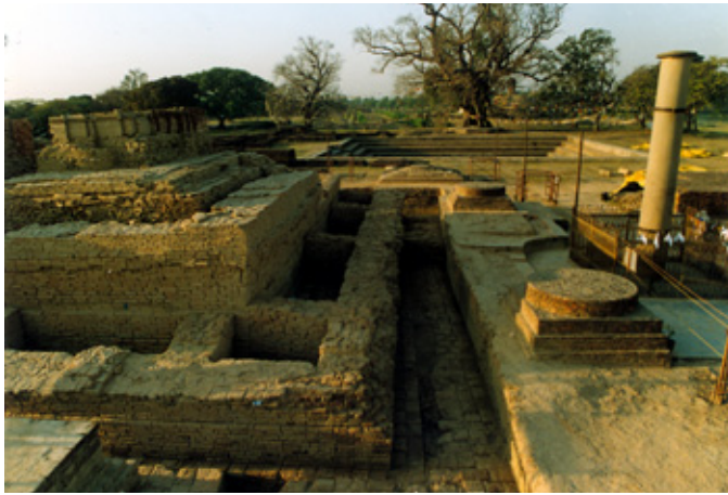
発掘されたマヤ堂の全景 右の石柱がアシヨカ王建立の石柱