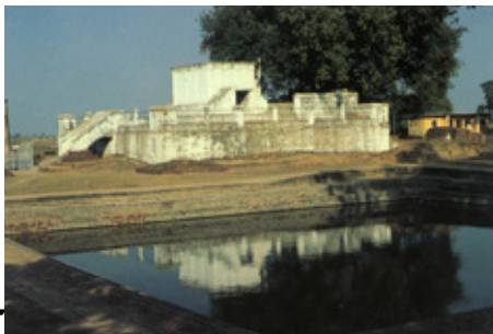
解体前の旧マヤ堂