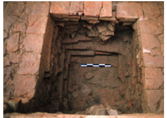
マヤ堂真下から発見された「マーカーストーン」

世界遺産となったマヤ堂の早期の修復のため、本会はネパール側の希望を受け入れ遺跡を展観しての復元案を提案した。この案は遺跡全体をドームで覆う方式であり、基礎工事が軽微なため周辺の遺跡を破壊しない案であり、ユネスコも評価した有用な案であった。