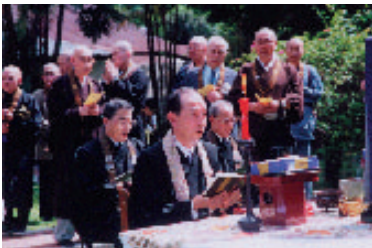
追悼法会の導師を務める大谷光真会長

開会式前日十二月九日、WFBセランゴール地域センターとの懇親昼食会の後、クアラルンプール日本人墓地に移動し追悼法会を行いました。