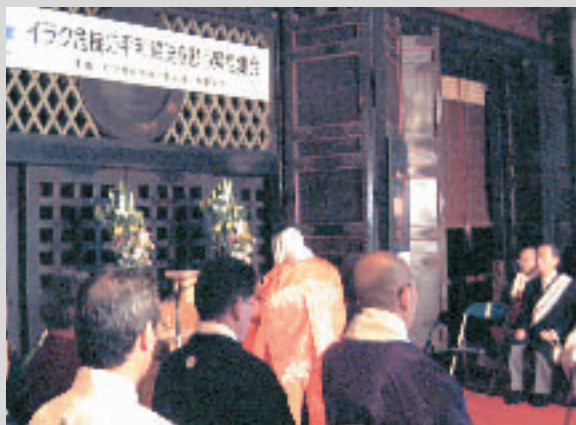
比叡山で行われた「平和解決を願う緊急集会」

また、二月二十日比叡山で行なわれた世界宗教者平和会議主催によるイラク危機の『平和解決を願う緊急集会』にも参加し、声明文を採択し世界平和を祈った。