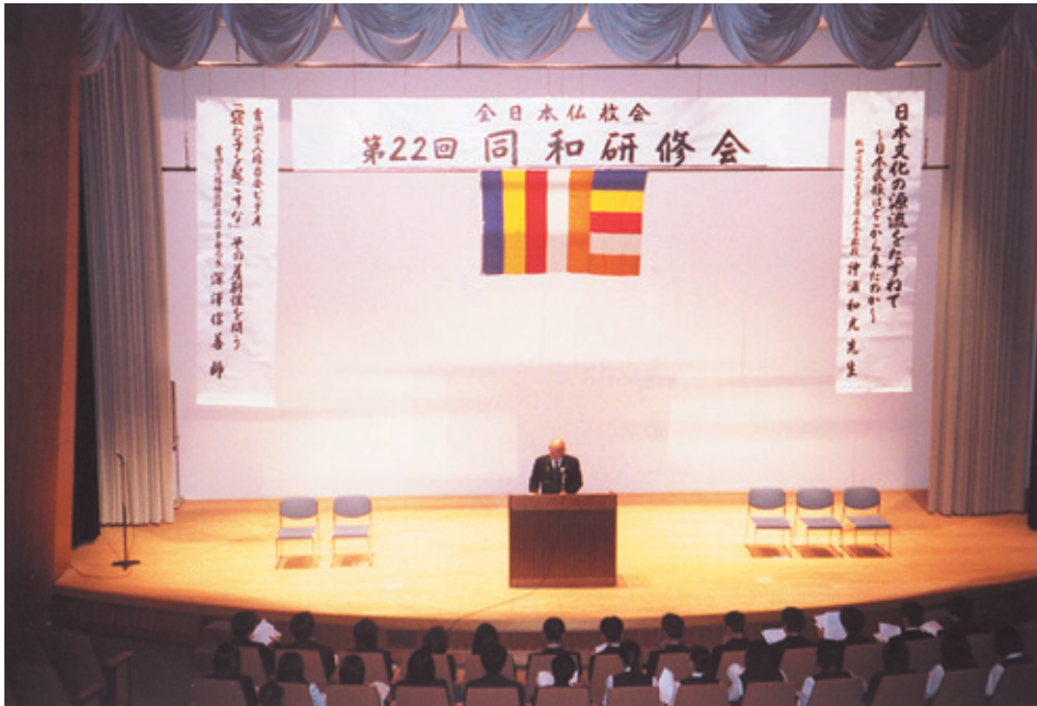
真宗大谷派真宗本廟視聴覚ホールで行われた同和研修会（関連記事4頁）

仏暦2545年12月（2002年） 財団法人 全日本仏教会 JAPAN BUDDHIST FEDERATION