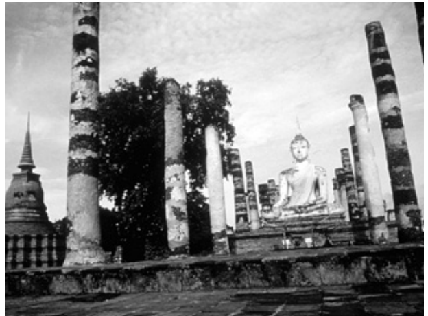
スコタイ・ワット・サー・シー寺院

その後、歴史ある古都チェンマイ、壮大な王朝遺跡が広がるスコタイへと移動し、各所の歴史ある仏教寺院などを参拝する予定です。この時期、気候の温暖なタイで開催される意義ある大会に一人でも多くの方がご参加下さいますようお願い申し上げます。