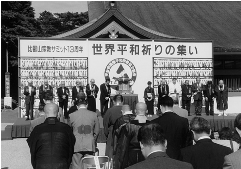
比叡山宗教サミット13周年世界平和祈りの集い（関連記事8頁）

仏暦2543年10月（2000年） 財団法人 全日本仏教会 JAPAN BUDDHIST FEDERATION