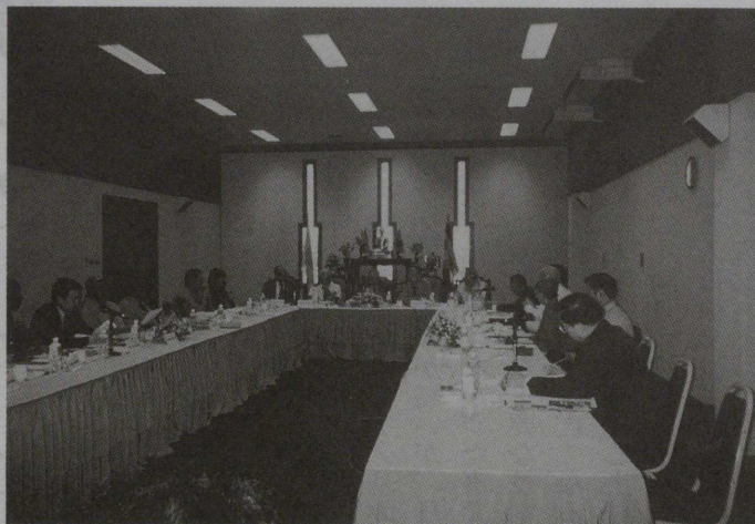
WFB執行委員会（6月17・18日 於、バンコク）