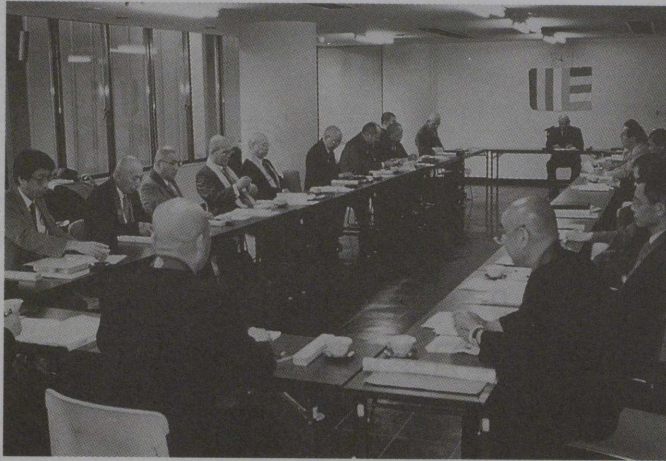
増上寺大殿南側信徒控室で開催された都道府県 仏教会代表者会議（6月30日）