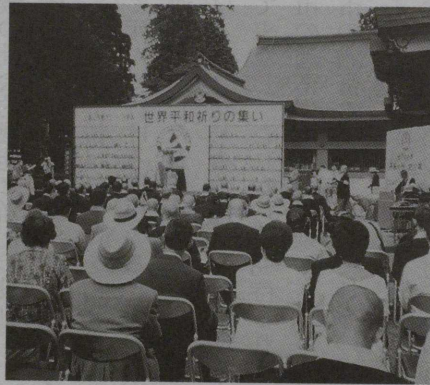
世界平和祈りの集い（8月4日 於 比叡山）