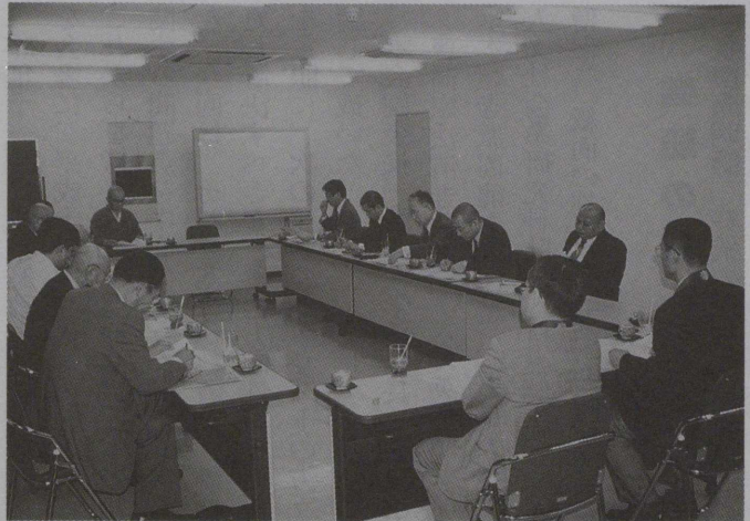
税務委員会（6月25日 於、明照会館）