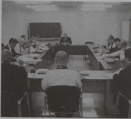
ルンビニー委員会（6月26日 於 明照会館）

また、前日LDTより提示されたマヤ堂復元に向けてのアグリーメント再修正案について、次回委員会で詳細に検討が加えられ、対応が協議されることとなった。