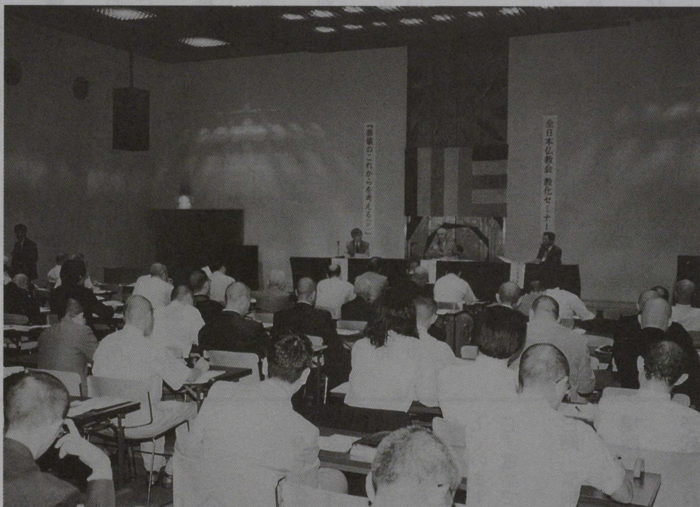
教化セミナー「葬儀のこれからを考える(2)」(関連記事4~7頁)

仏暦2542年 9月 (1999年) 財団法人 全日本仏教会 JAPAN BUDDHIST FEDERATION