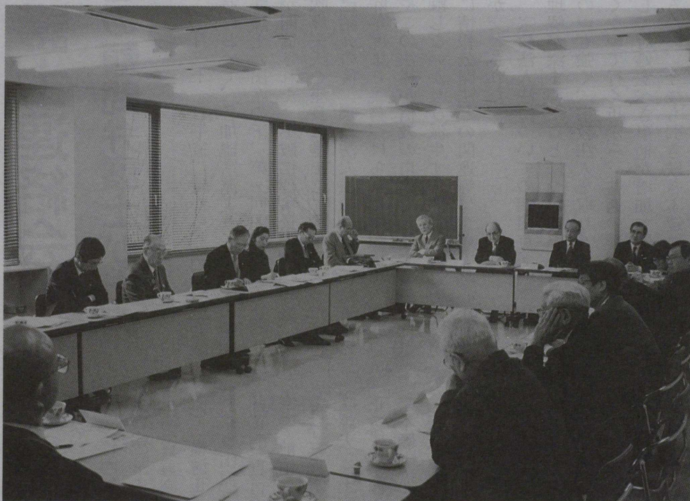
加盟宗派顧問弁護士連絡会 (関連記事2頁)

仏暦2542年 5月 (1999年) 財団法人 全日本仏教会 JAPAN BUDDHIST FEDERATION