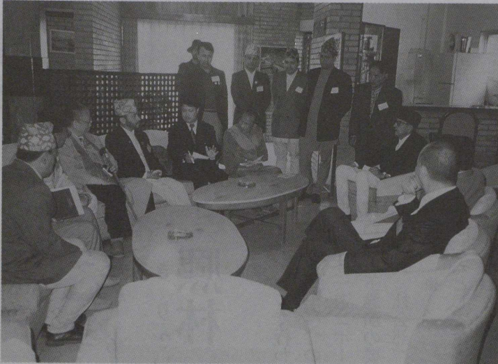
ネパール・ユネスコ関係者と会談する全仏代表者