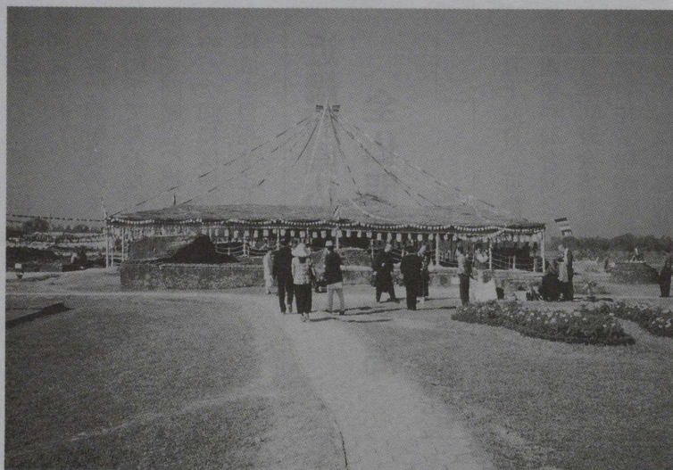
世界仏教サミット当日のマヤ堂遺跡

主張が平行線をたどる中、一九九八年七月にルンビニー開発トラストは、遺跡を露呈してのマヤ堂復元計画の設計案を提示してきました。