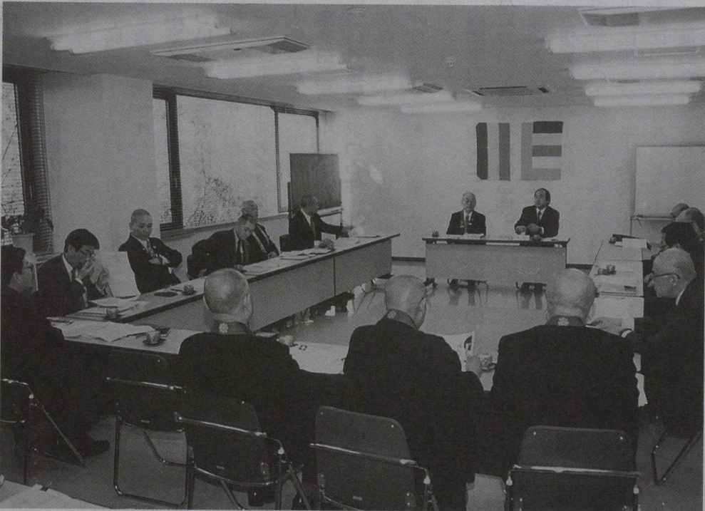
戒名(法名)問題に関する研究会(関連記事5頁)

仏暦2542年 3月 (1999年) 財団法人 全日本仏教会 JAPAN BUDDHIST FEDERATION