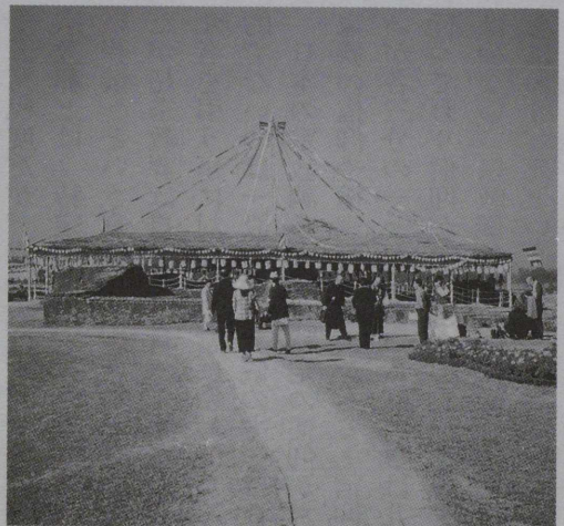
サミット当日のマヤ堂修復現場