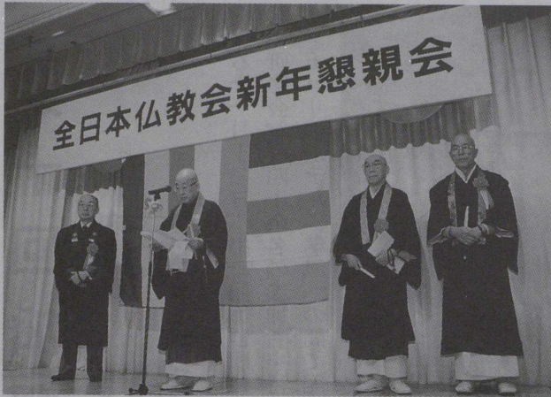
懇親会で祝辞を述べる演野会長