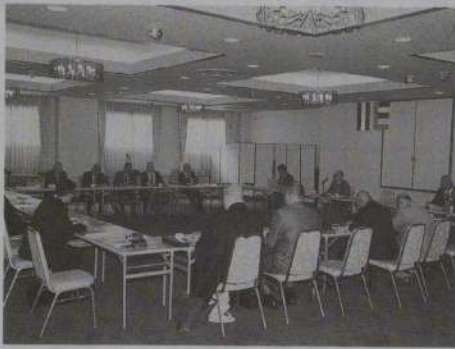
築地本願寺で開催された 都道府県仏教会代表者会議