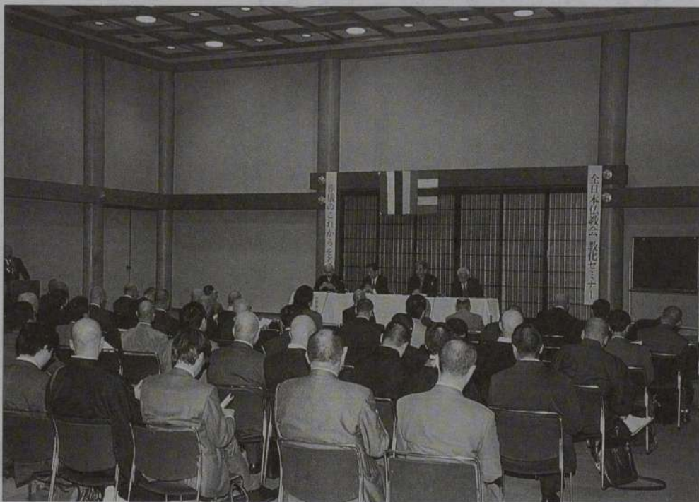
教化セミナー「葬儀のこれからを考える」(関連記事4~5頁)

仏暦2542年1月(1999年) 財団法人 全日本仏教会 JAPAN BUDDHIST FEDERATION