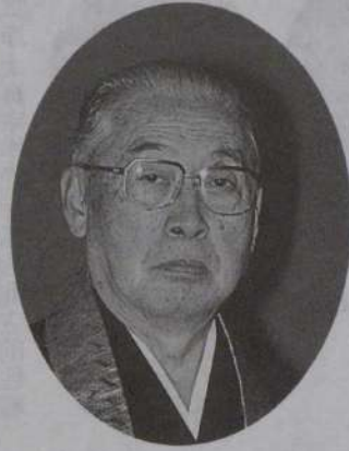
全日本仏教会理事長