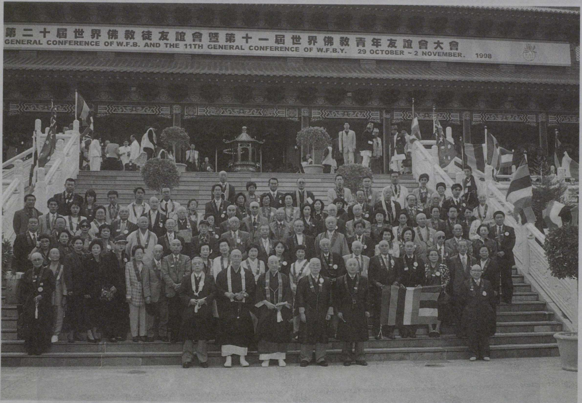
南天寺本堂前の全日本仏教会代表団

WFBB（世界仏教徒連盟、本部タイバン コク）世界仏教徒会議が十月二十九日から十 一月二日の日程で、オーストラリア・シドニ ー郊外ウーロンゴンの仏光山南天寺で開催さ れた。