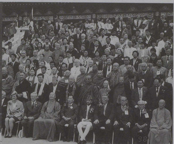
世界各国からの代表団