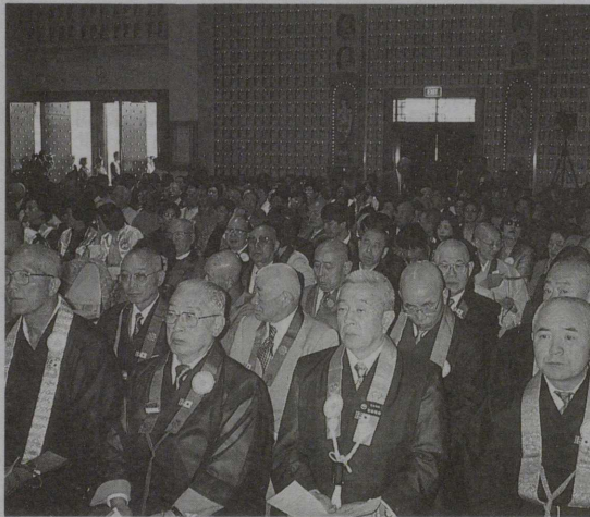
開会式に臨む全仏代表団