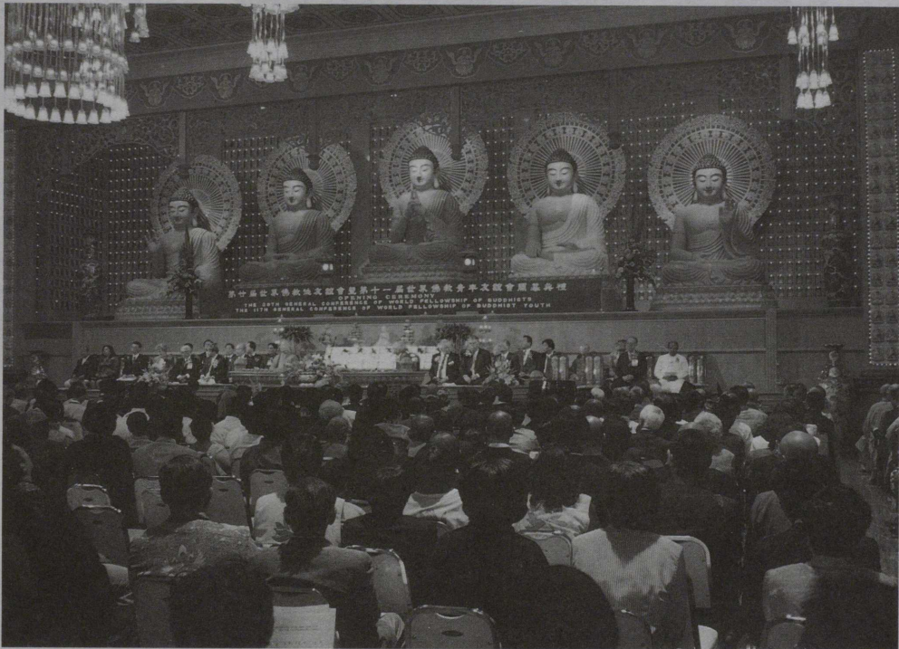
第20回 WFB 世界仏教徒会議開会式 (関連記事 2 頁～ 4 頁)

仏暦2541年12月 (1998年) 財団法人 全日本仏教会 JAPAN BUDDHIST FEDERATION