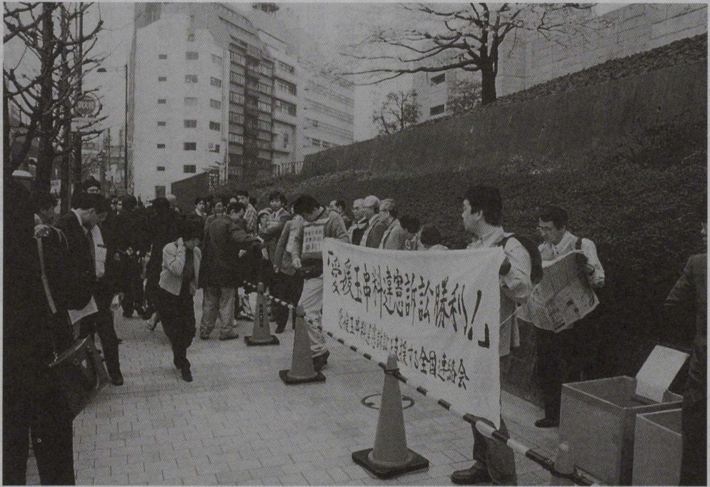
愛媛玉串料違憲訴訟判決公判に集まった原告支援者 (4月2日 最高裁判所前、関連記事4~5頁)