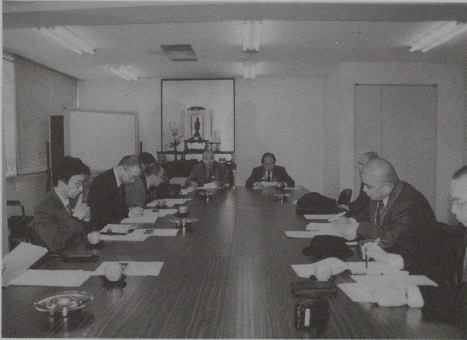
仏教とマルチメディア研究会(4月11日 於 明照会館)

冒頭に荒川事務総長が、「この研究会は、昨年七月の教化セミナーでの協議を経て、発足することになった。何かを決定するのではなく、仏教界がマルチメディアをどう利用し