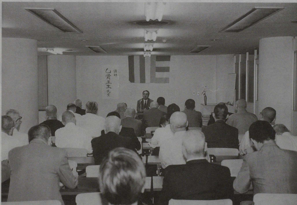
信教の自由に関する委員会講演会 (関連記事 8 頁)