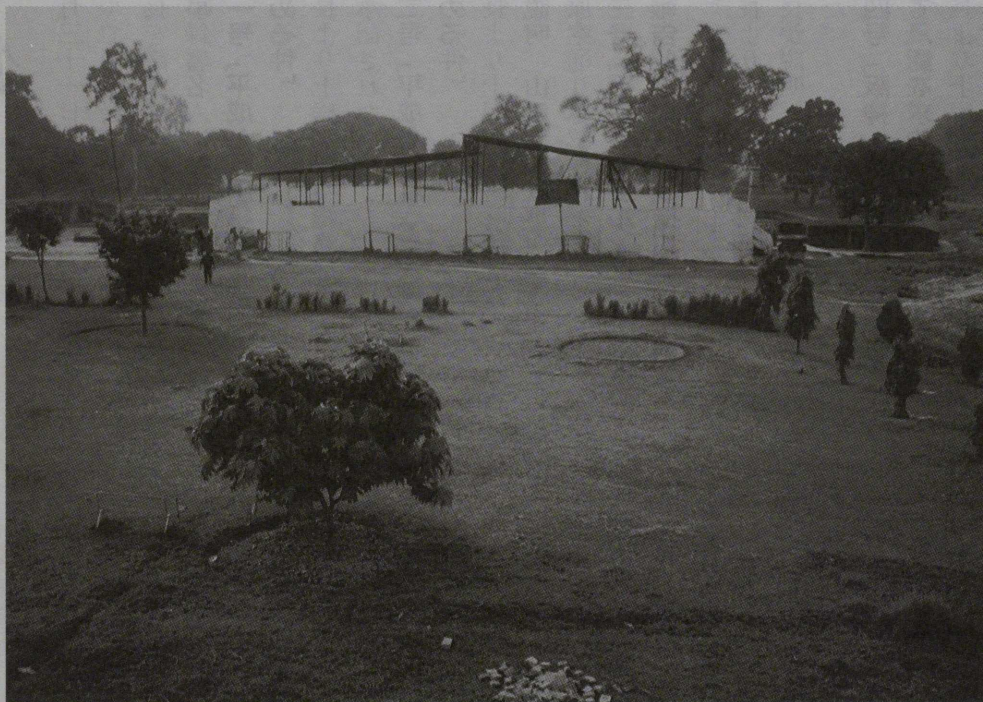
マヤ堂発掘現場の遠景