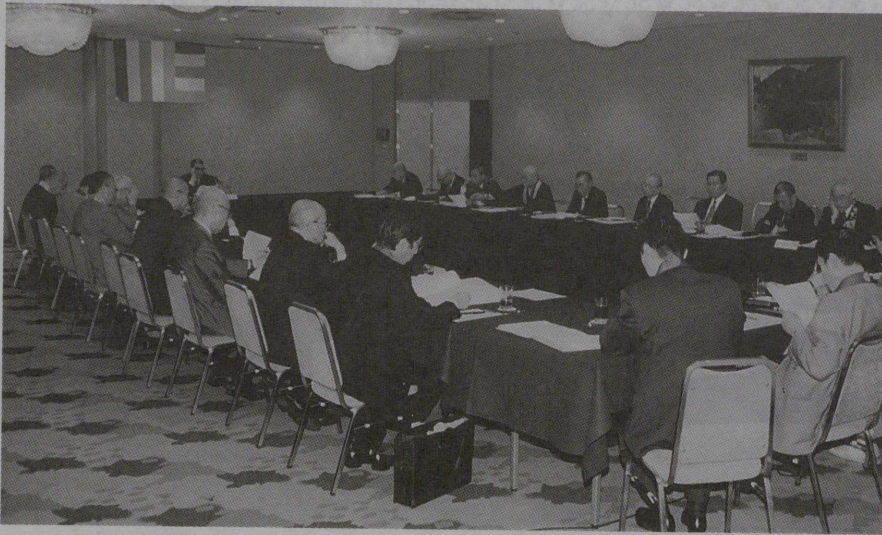
京都グランドホテルで開催された理事会