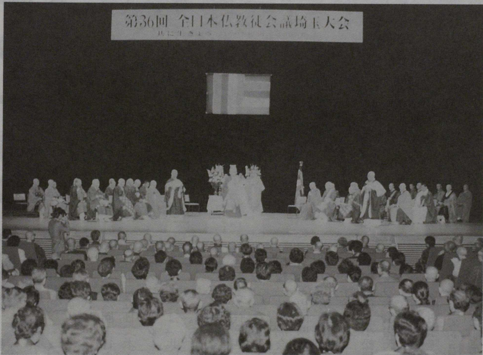
第36回全日本仏教徒会議埼玉大会開催 (大宮ソニックシティで行なわれた式典)