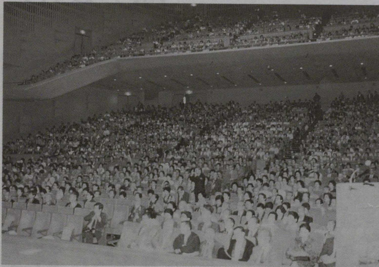
大宮・ソニックシティを満員にした 二五〇〇名の仏教徒

第三十六回全日本仏教徒会議埼玉大会が、 さる十月五日（木）午後一時より、埼玉県大 宮市のソニックシティにおいて開催された。 今次大会は「共に生きよう ―かけがえの ない このいのち―」との大会テーマのも と、二千五百余名が参集し、また韓国仏教宗 団協議会の代表四名にもご来席いただいた、 盛大かつ熱意溢れる大会となった。