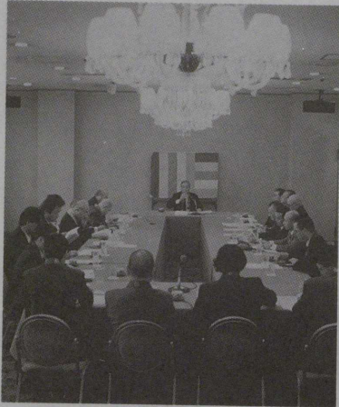
赤坂プリンスホテル で開催された理事会