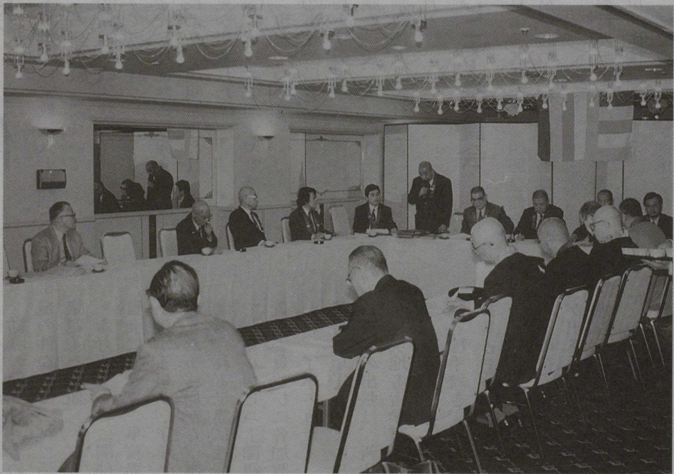
東京グランドホテルで開催された理事会 (関連記事2頁)