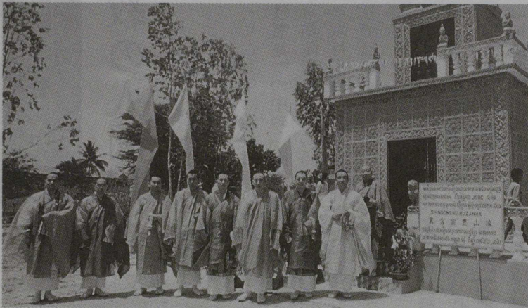
(上) 舍利塔の並ぶ納骨堂内部 (下) 法要団一行 右端が筆者

早速、直綴と袈裟を着ける。行道は何百人もの子供の拍手の中を歩く。全部で二千人はいるだろうか。沢山の白い法衣の比丘尼が合