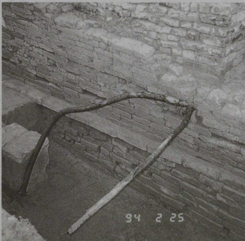
遺構の中にはびこる菩薩樹の根

である。その上で、何か遺物ができればそれなりに上部構築物の内部および外観を考えるべきである。また、何もでてこなくても、出来るだけの誠意をつくしたということで、世界の仏教徒も納得するであろう。その上で、適宜に構築物を作ることが可能となる。 三、上記の掘り下げは、マヤ堂発掘がかなり進んでいる現在の状況からみて、あと一シーズンあれば実行出来ようというのが大方の考古者の見解であった。 四、JBFとLDTの関係から、日本・ネパール両国の考古学者が協力して発掘にあっているが、出席した考古学者（特に旧英領のインド、パキスタン）のネパール考古学者に対する評価が、日本の考古学者に跳ね返っ