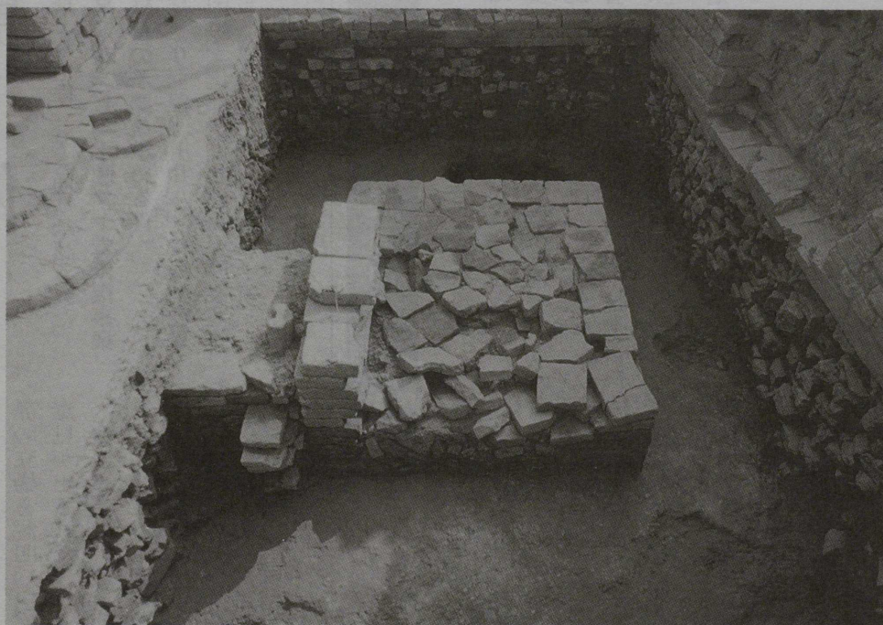
マヤ堂直下の遺構