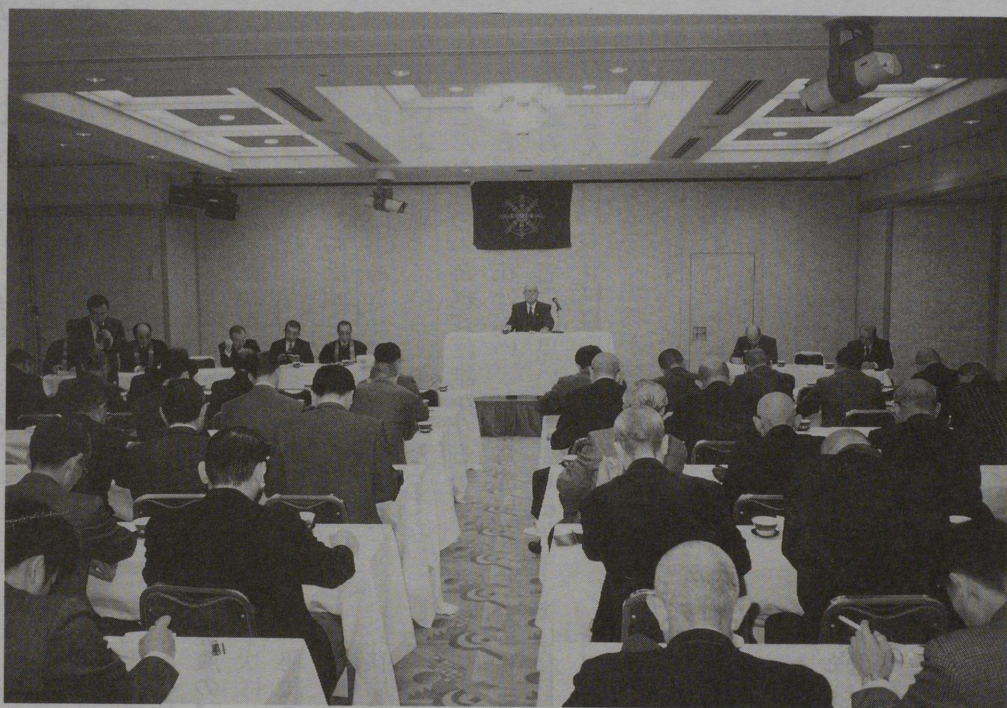
福岡県仏臨時総会 (関連記事 8 面)