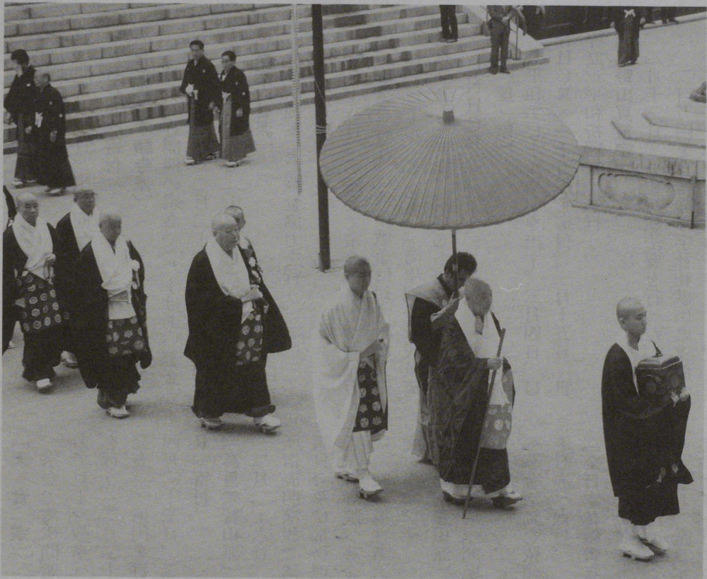
高野山真言宗管長晋山式