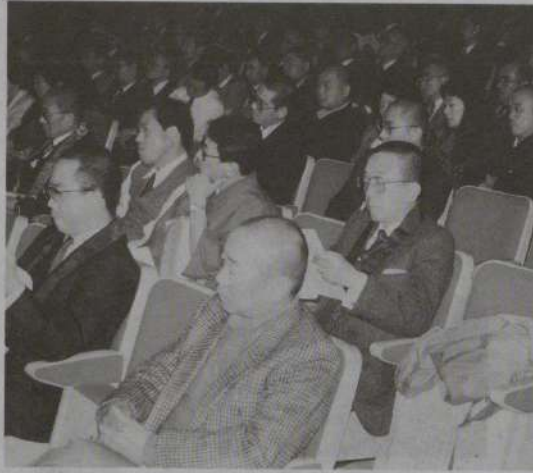
熱心に講演を聞く参加者

本会主催の第十回同和研修会が、昨年十一月十六、十七の両日にわたって、浄土宗総本山知恩院の和順会館を会場に、加盟の各宗派、都道府県仏教会から関係者約百名が参加して開催された。今回の研修会は、国連が定めた国際識字年にあたる事を記念し、「仏教徒の行動―人間解放の社会をめざして―」をテーマに、識字と部落差別の問題を中心に研修を行った。