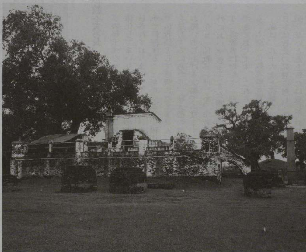
北側から見たマヤ堂の全景