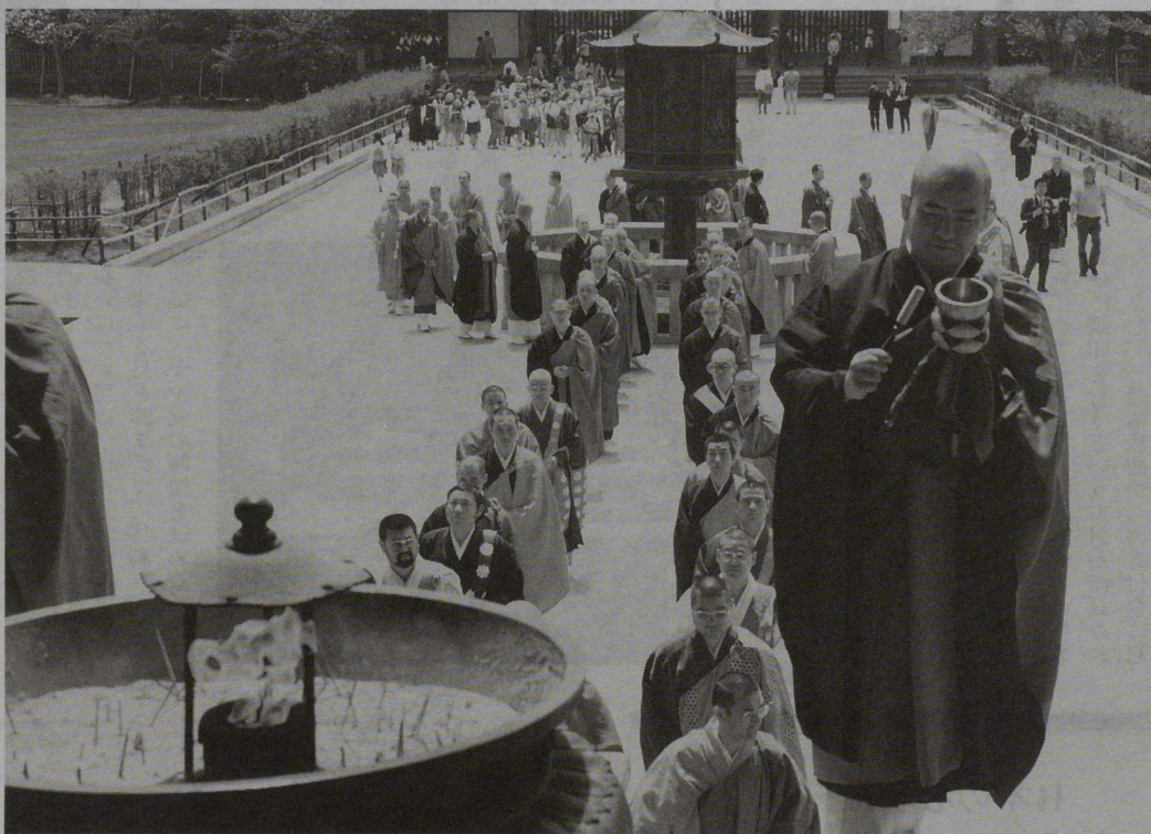
全日本仏教青年会の奈良結集で東大寺大仏殿前を行道する青年僧 (関連記事8面)