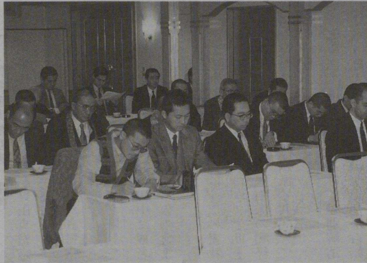
熱心に聴講する出席者

師によると、迹門の一番最後に当たるものであると云われている。仏道修行の初心の方法、一番初めの心遣いを説いたのが「安樂行品」である。