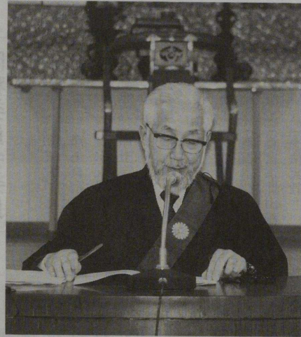
講演される新聞智照師

昭和六十一年九月、大阪の部落解放センターで開催された部落解放研究所宗教学部会で、日蓮宗同和委員は業問題について次のような見解発表を行った。