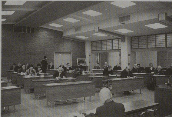
日蓮宗宗務院で開かれた同和研究会

このように単純に結びつけると、善悪、苦楽ということが、世俗的な規準と、仏教で考える規準とが混同して、おかしな解釈を生むことになる。したがって、私たちは仏教を規準とする善悪を考えなければならぬ。善悪苦楽を、自分の判断