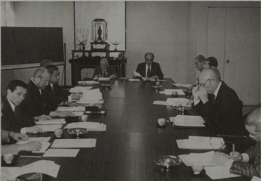
新しく発足した「ルンビニー委員会」(4月12日)