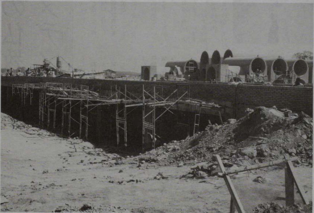
—完成間近の中央友情橋—