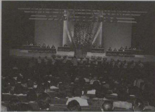
開かれたテンプルトン賞記念講演会

去る六月十日、立正佼成会普門館大ホールで、テンプルトン賞記念講演会が開催された。