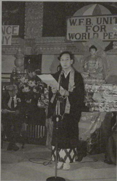
日本を代表して挨拶する大谷会長