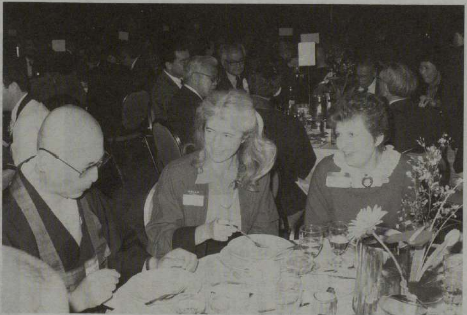
なごやかな交歓風景、熱心に話を聞くアメリカのご婦人

ない次第であります。私はひそかに思いますのに、そのさい日系人の皆様の精神的支柱として仏教の信仰が与って力があつたものと信じてるのであります。そうして日系人の方々と共に汗を流して開教に挺身し、当地の仏教の興隆に偉大な貢献をした開教使の皆さま、その開教使を助け