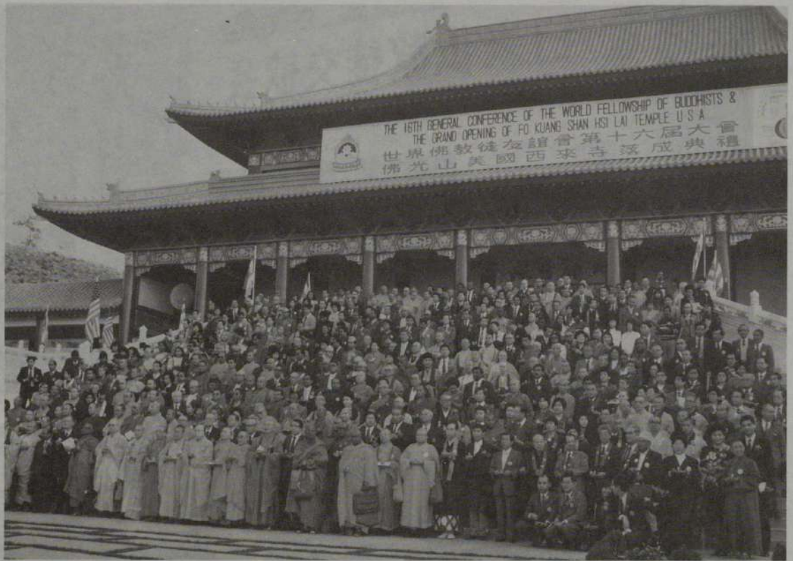
開会式会場を一杯に埋めた各国代表の参加者たち

教界や仏教徒に物心両面にわたり支援を期待する人々が多いことである。釈尊誕生の地ルンビニー園開発問題や、バングラーディッシュやスリランカの水害救援活動や、世界仏教徒連盟の財政基盤の強化な