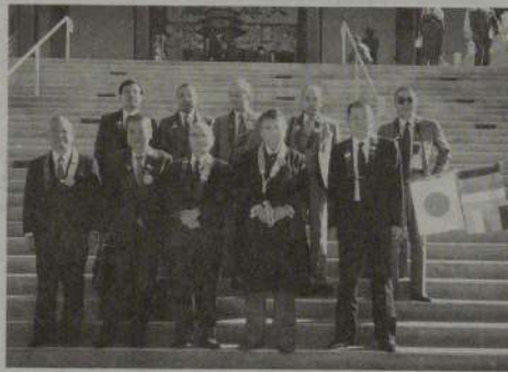
日本から参加した代表団

最後に、本会議のテーマである「世界平和のためにWFBの一致協力を」の趣意が世界の仏教徒に及ぶことを念願してご挨拶いたします。