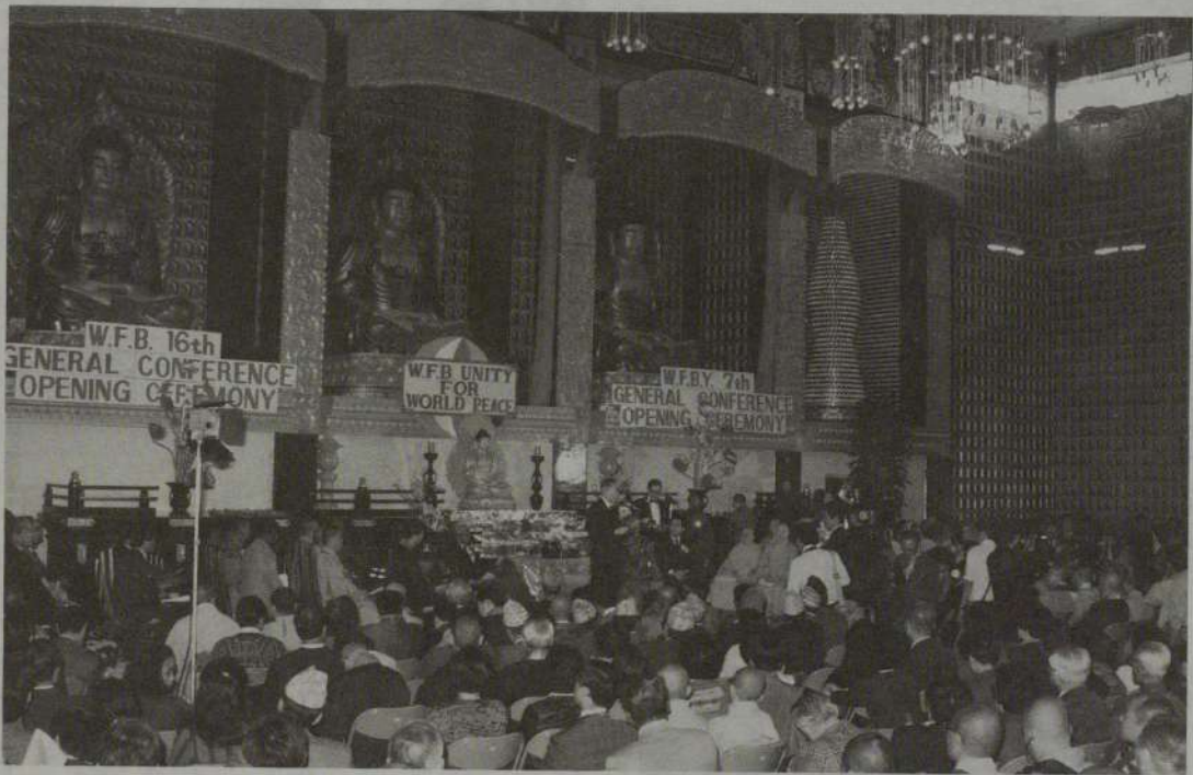
ロサンゼルス市・仏光山西来寺のWFB開会式に集った各国代表