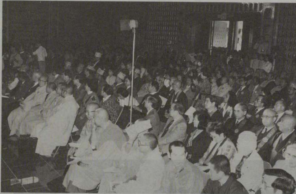
会場内に勢揃いした二十一カ国の代表者たち

第十六回世界仏教徒会議ロサンゼルス大会は、昨年（一九八八）十一月十九日から二十五日まで、アメリカ合衆国ロサンゼルス市郊外の台湾系寺院、仏光山西来寺を会場に開催された。