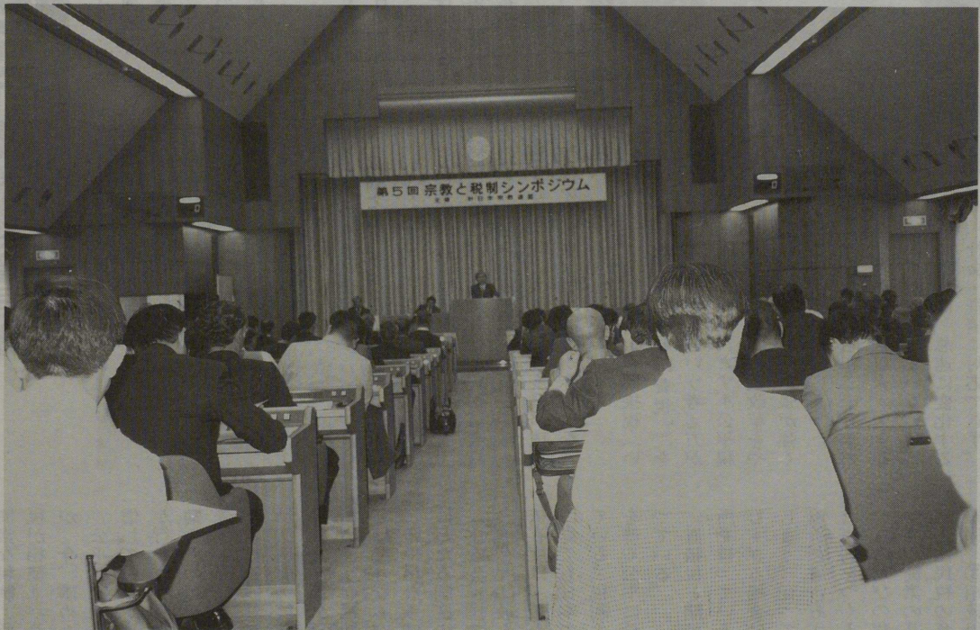
神社本庁2階の大ホールで開かれた「第5回宗教と税制シンポジウム」