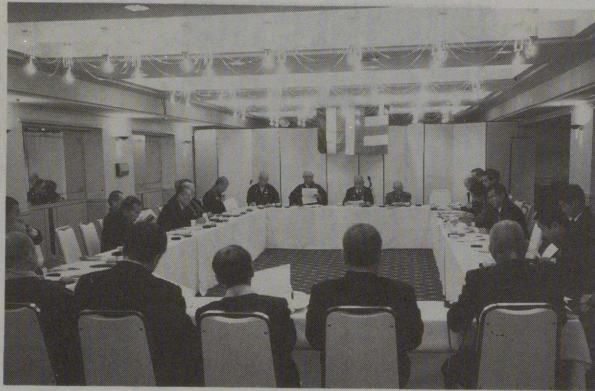
議案を審議する全仏理事會

..... 本会の理事會が、去る十一月十五日午後一時から、東京グランドホテルで開催された。