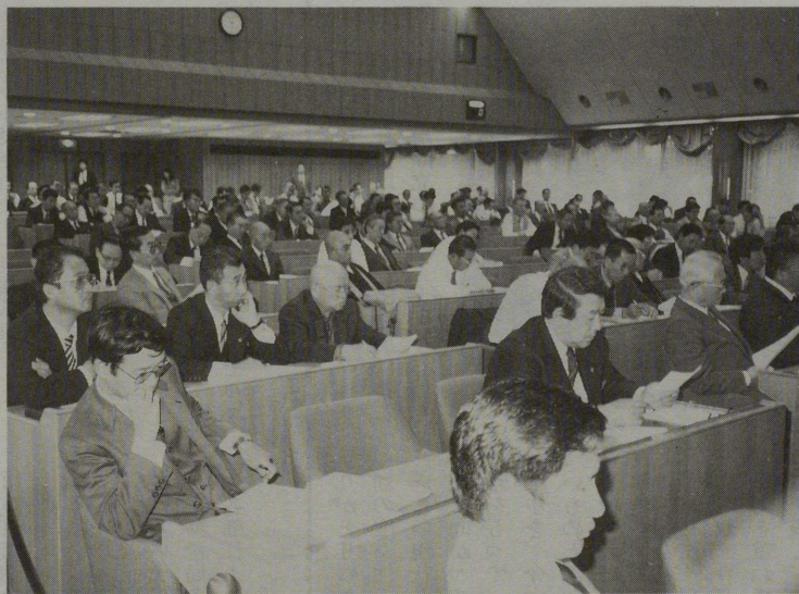
本社本庁の大ホールで熱心に聴講する参集の人々

④宗教法人の「税逃れ」や「ビジネス化」などが目立っている。こうした例は一部であるにしろ、宗教法人の「公益性」「社会性」に対する疑問となっている。現行宗教法人税制の維持には、一般庶民、